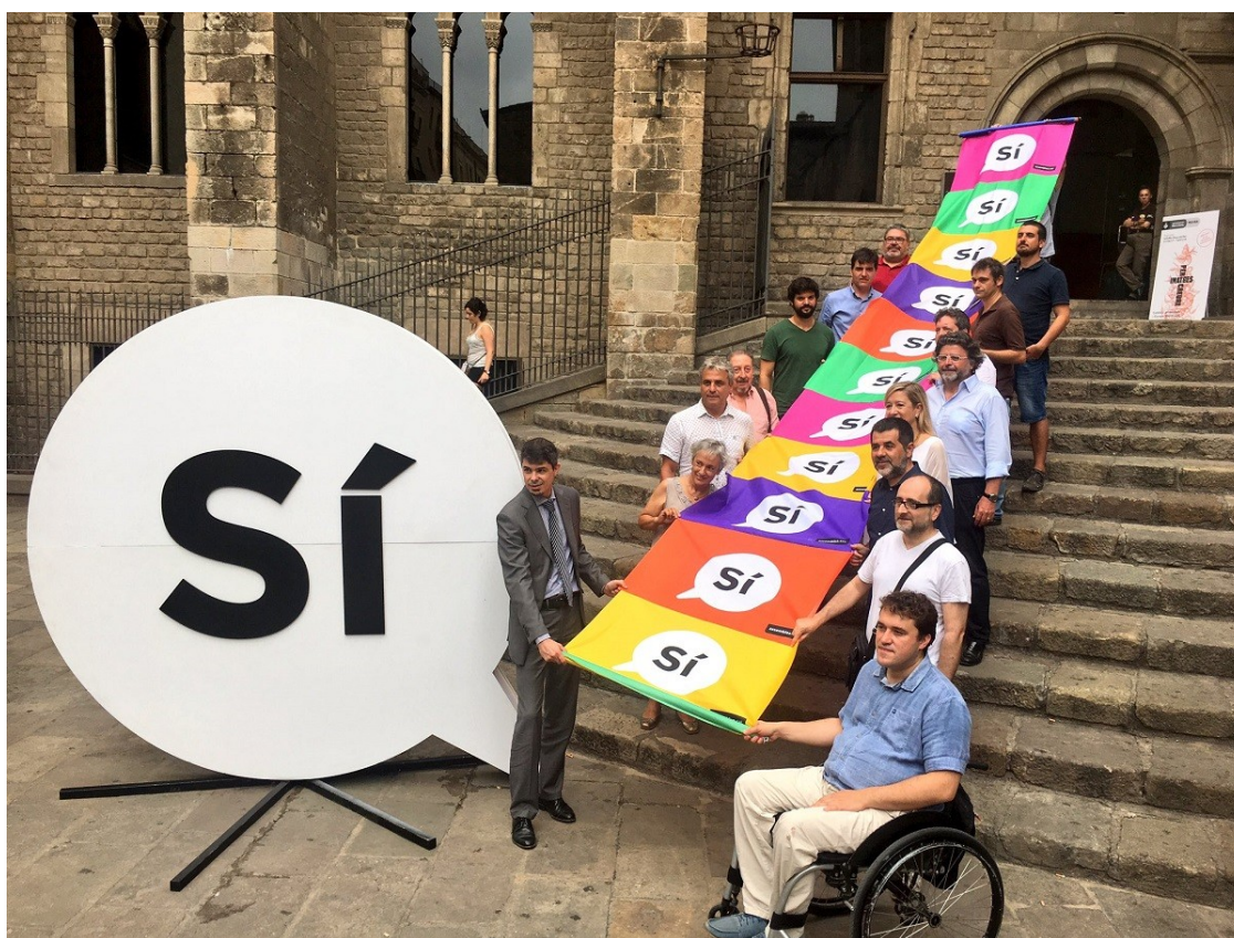
Presentació de la campanya pel sí a la independència | ANC

Deu preguntes i deu respostes sobre la iniciativa conjunta que entitats i partits començaran oficialment la matinada del 15 de setembre