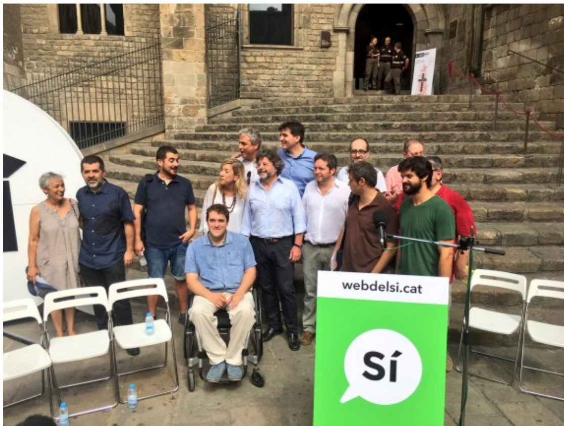
Roda de premsa de presentació de la campanya del «sí».

A banda dels recursos que aporten els partits -en el cas d'ERC, els republicans destinen un milió d'euros a la campanya pel referèndum-, la iniciativa unitària podrà ser finançada a través de micromecenatge ( https://webdelsi.cat/donatus/ ). Sánchez ha recordat que l'ANC "no rep finançament públic", i ha confiat que es puguin aconseguir "milions d'euros". Les entitats ja van posar en marxa una campanya de crowdfunding per sufragar multes a càrrecs electes.