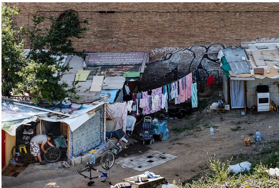
Un home arregla una bicicleta en una barraca a prop de Glòries