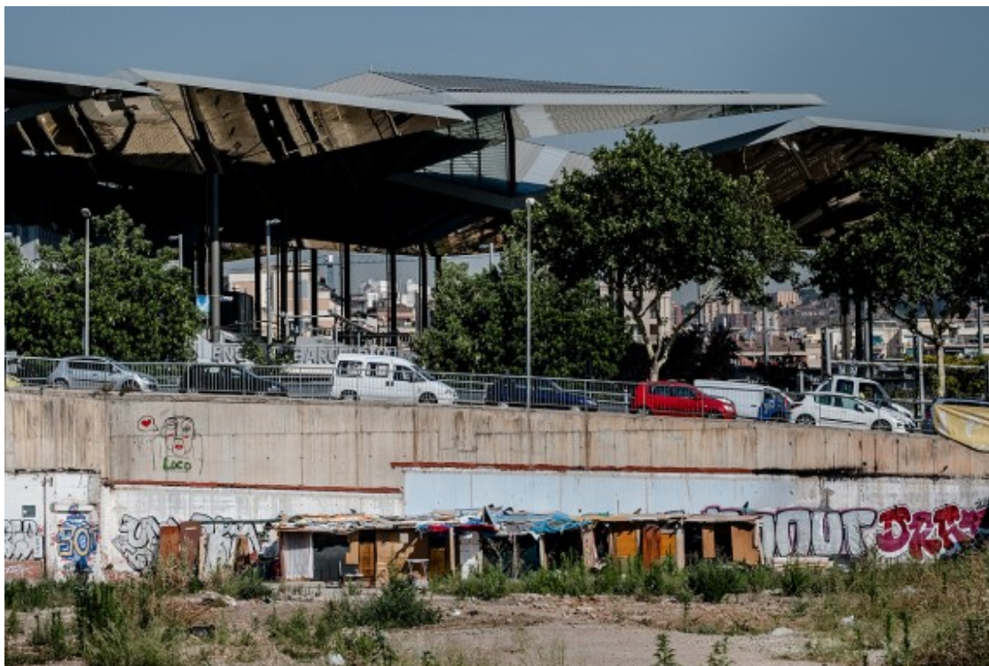
A un costat de la Meridiana, els Encants; a l'altre, les barraques.

Alguns atesos pels serveis socials queden estancats als llims: no cobren el suficient per accedir a una llar, tampoc per anar a viure fora de Barcelona en un pis més barat perquè no es podrien pagar el viatge, i sempre necessiten el suport social. És el cas d'alguns senegalesos que tenen permís de residència i treball, i que viuen en una habitació rellogada i "no els arriba ni per menjar", relata Sales. "Si estàs en una feina molt precària on et paguen 450 euros i per una habitació te'n demanen 400, la subsistència es fa impossible", adverteix.