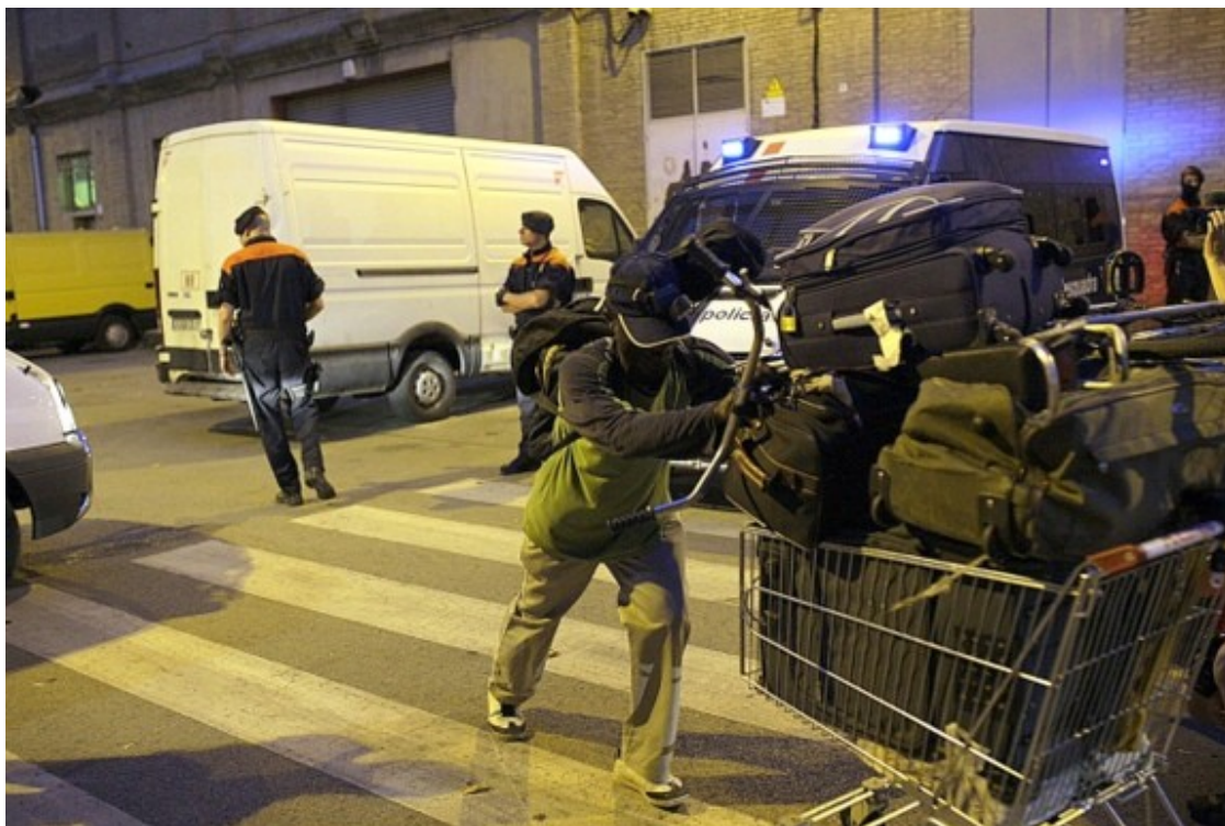
Un dels ocupants de la nau del carrer Puigcerdà, abandonant-la carregat de ferralla.