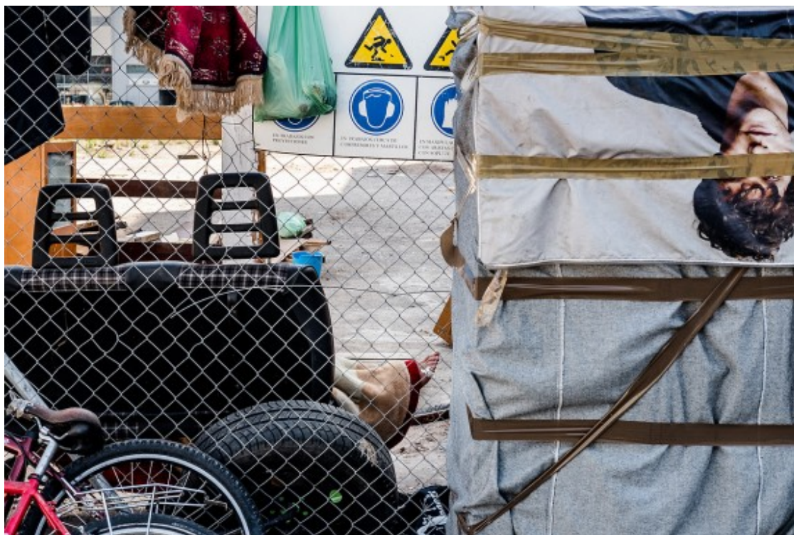
Un home dorm en un assentament d'un solar del carrer Pamplona.

En Ion mostra la panxa per afirmar que està "malalt". Parla en romanès, però es fa entendre i treu de la butxaca una fotocòpia del document d'identitat del país on va néixer. Assegura, emocionat, que ja no li queda família, i opta per continuar el passeig que havia començat però que havia quedat momentàniament interromput per la conversa. A prop de la Meridiana viu una parella que semblaria del mateix origen. A la dreta, les barraques en primer pla. A l'esquerra, un hotel de fons. Declina, però, respondre a periodistes. "L'assistenta m'ha dit que no parli", insisteix la dona.