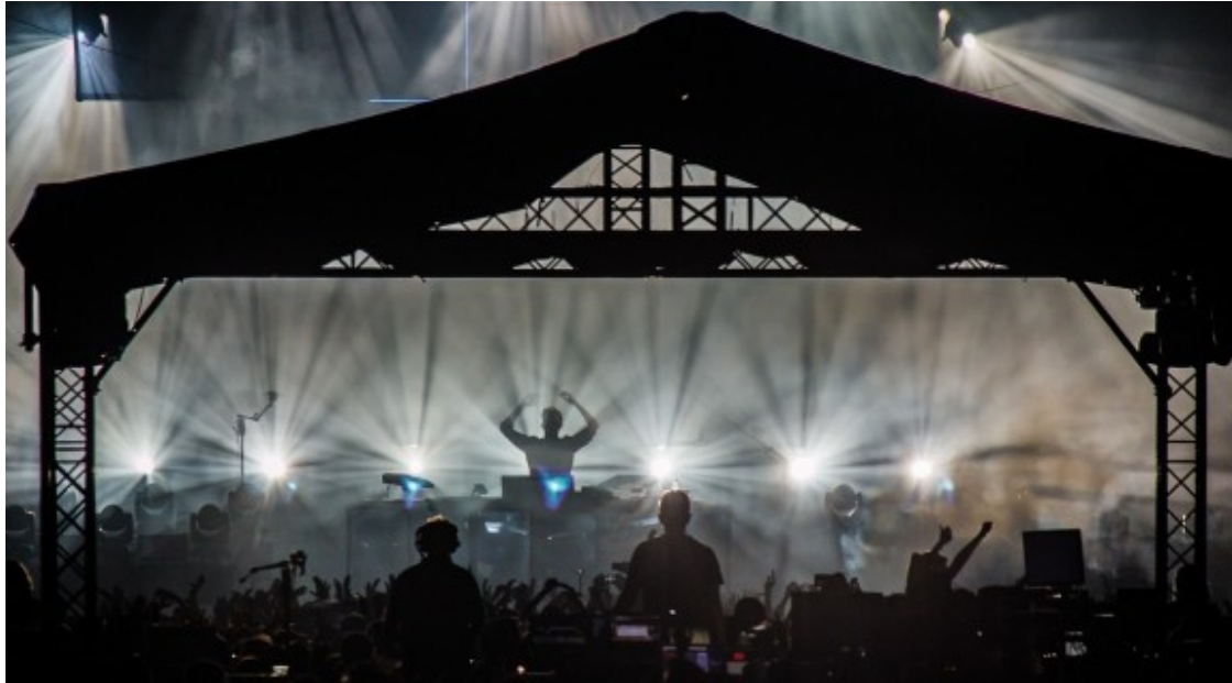
Sónar de Nit 2016

En total, l'edició 2017 del Sónar compta amb un pressupost de 7.900.000 euros, amb 920 periodistes i 417 mitjans acreditats procedents de 37 països. La procedència dels visitants mostra un percentatge del 47,66% pel que fa al públic català i de la restat de l'Estat, i un 52,34% de la resta del món. Fins aquest dijous, s'han venut entrades a 105 països, entre els quals destaquen el Regne Unit, França, Itàlia, Alemanya, Suïssa i els Estats Units.