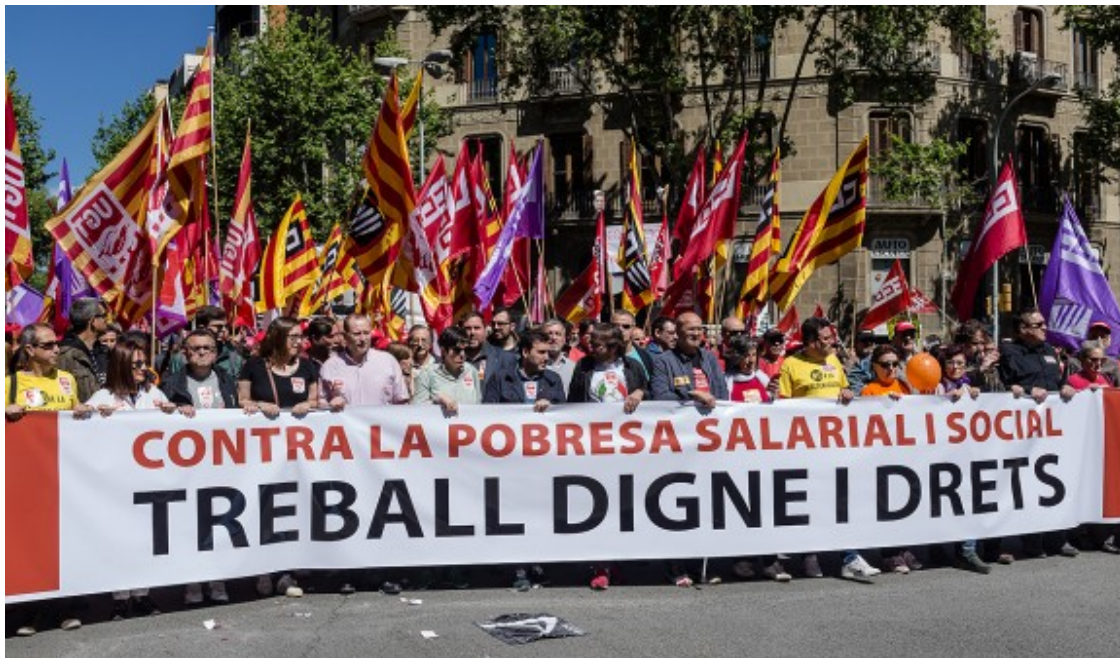
Manifestació dels sindicats en el darrer 1 de Maig.

Gallego defensa que l'enquesta ratifica la posició del sindicat de defensa del dret a decidir, la qual veu compatible amb el posicionament de CCOO estatal | El partit amb qui més s'identifiquen els afiliats és ERC (24,8%), tot i que amb un escàs marge per sobre de Podem (23,8%) o ICV (19,8%)