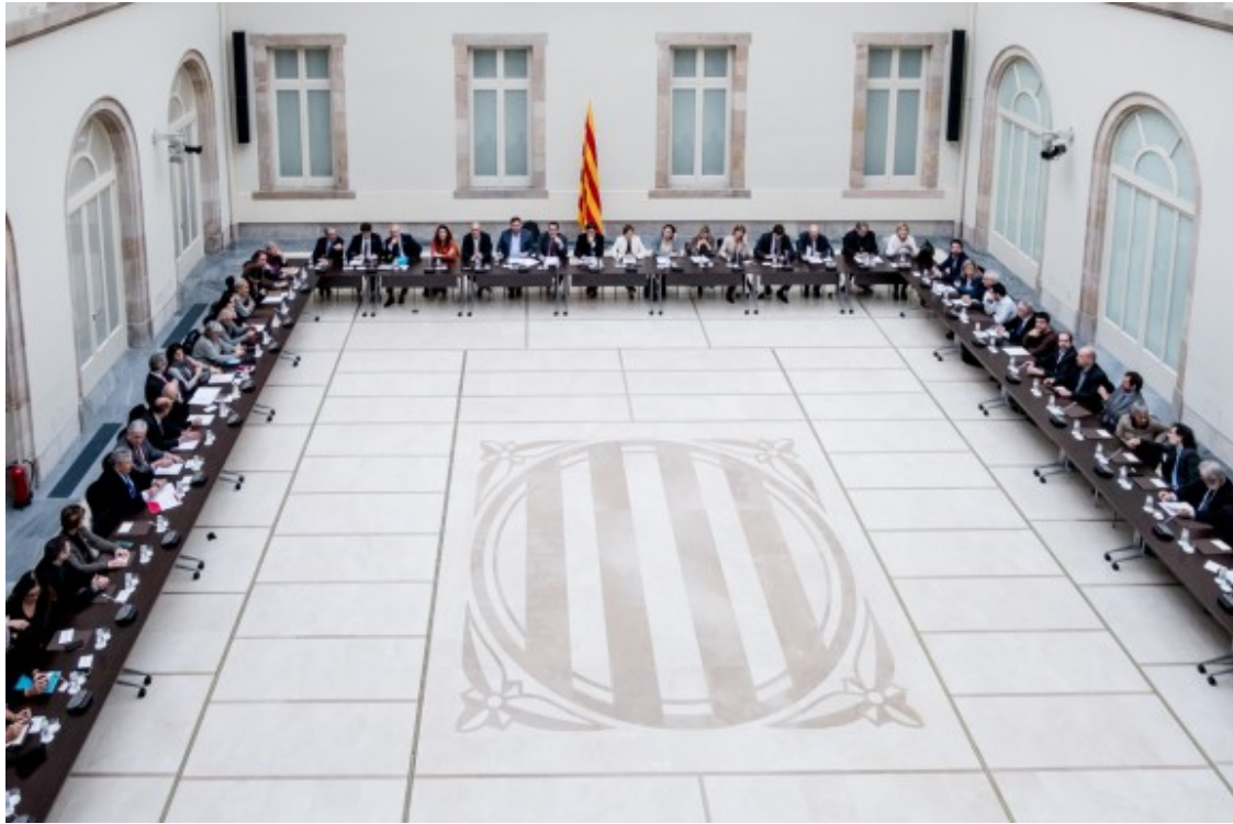
Imatge de la reunió del Pacte Nacional pel Referèndum