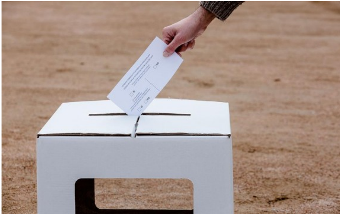
Urna del 9-N

Els dirigents consultats destaquen que ningú "cometrà il·legalitats", i s'apunta que els responsables polítics seran els qui "assumiran les conseqüències". El més probable és que el mandat parlamentari del referèndum vagi a càrrec dels 72 diputats independentistes, i les veus més pessimistes indiquen que "se'ls pot acabar veient a tots inhabilitats". En privat, hi ha dirigents del PDECat que assenyalen el component "enverinat" de l'encàrrec de Puigdemont a Junqueras: "Fins ara només nosaltres havíem posat en risc els nostres càrrecs, i ja els toca mullar-se a ells".