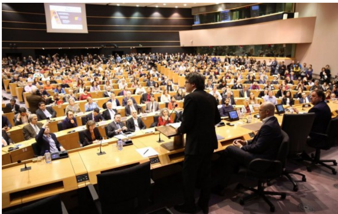
El president de la Generalitat, Carles Puigdemont, es dirigeix al públic des d'una sala del Parlament Europeu

La llei en discussió ha de dotar d'empara legal la plataforma que permetrà l'exercici del dret a vot dels catalans que viuen a fora. El Govern encara estudia si aquesta plataforma seria d'un sol ús -per atendre una cita amb les urnes- o, en canvi, tindria un recorregut per a tota la legislatura. A més a més, la previsió del departament de Governació és que es puguin fer "proves pilot" abans de posar en marxa el sistema, una avaluació que requerirà temps. Accelerar la convocatòria del referèndum deixaria poc marge de maniobra. Per això, al Govern consideren més "factible" l'horitzó del setembre.