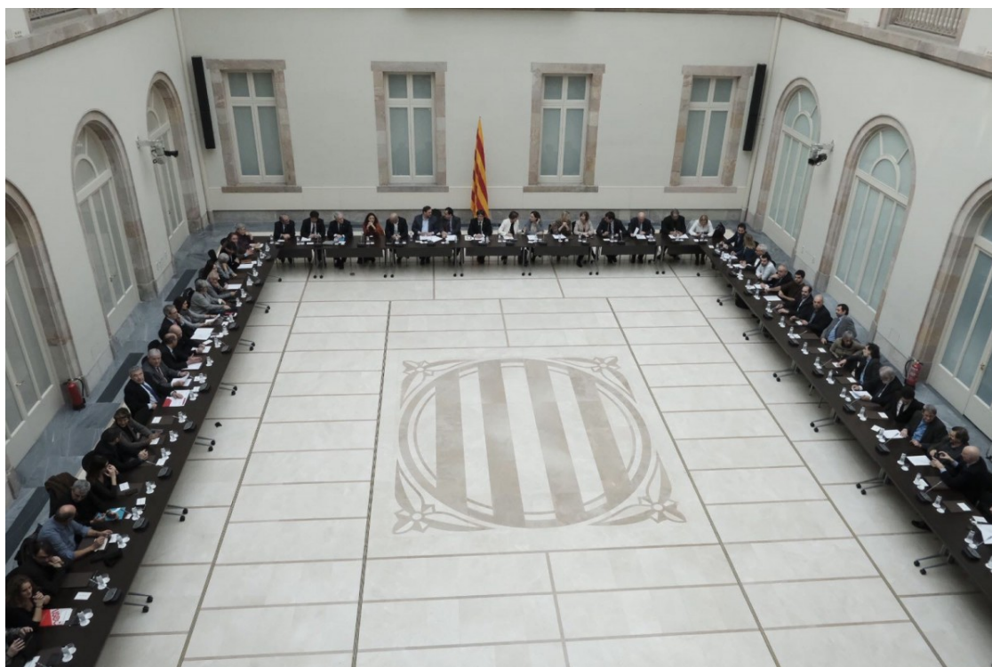
Segona reunió del Pacte Nacional pel Referèndum, aquest dimecres.