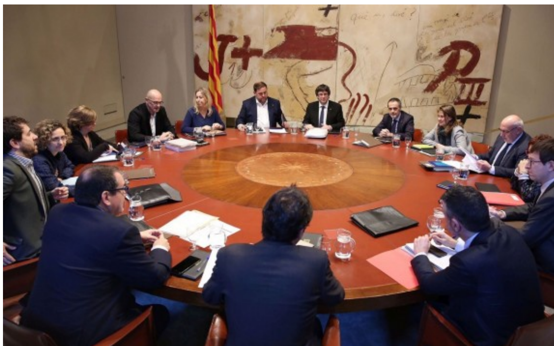
Reunió del Govern del 31 de gener del 2017

En aquest sentit, coneixedors dels treballs que s'estan fent indiquen que calen "concursos públics ben fets" per aspectes tan crucials com el software associat a la votació. "Hi ha moltes dificultats per avançar el referèndum", manté una veu consultada referint-se a l'arquitectura informàtica, que ha de ser adjudicada a través d'un concurs públic. L'experiència del 9-N posa de manifest que l'Estat "no permetrà que aquest cop hi hagi urnes", de manera que seguirà al detall l'activitat de la Generalitat i els seus processos de contractació.