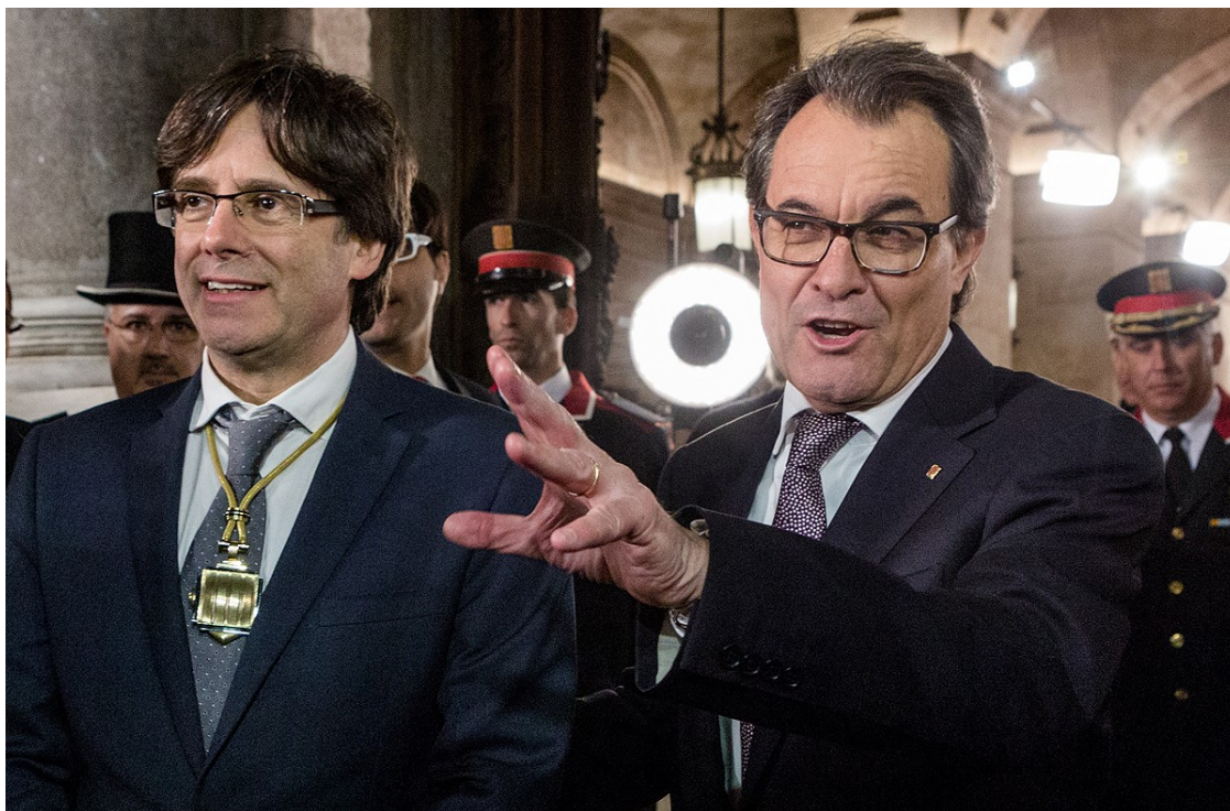
Artur Mas i Carles Puigdemont, en una imatge d'arxiu | Adrià Costa

Les dificultats per obtenir fitxatges de primer nivell, el calendari polític i l'aparició del nou lideratge de Puigdemont han desvirtuat la iniciativa, que passarà a integrar-se dins les sigles nacionalistes | Es compleixen dos anys de la conferència en què l'expresident va apostar per una llista unitària amb ERC i independents per aprofitar l'onada del 9-N