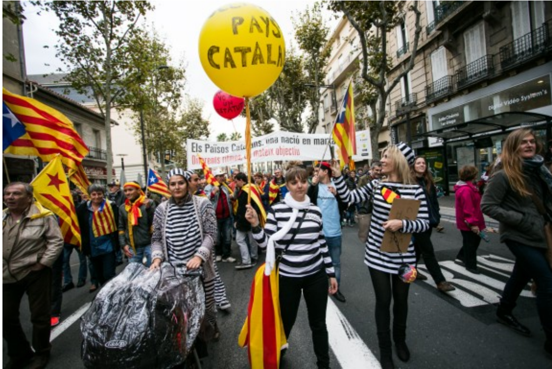
Manifestació «Sem Catalunya Nord, sem un país català. Volem decidir» a Perpinyà el dissabte passat.

El passat dissabte, 5 de novembre, una manifestació va recórrer els carrers de Perpinyà ( http://www.naciodigital.cat/noticia/119229/manifestacio/reivindica/unitat/dels/paisos/catalans/perpinya ), a la Catalunya Nord, sota el lema "Sem Catalunya Nord, sem un país català. Volem decidir". La marxa va servir per cloure els actes del Correllengua de Perpinyà, i es fa coincidir amb el 7 de novembre, dia en què es commemora la signatura del Tractat dels Pirineus.