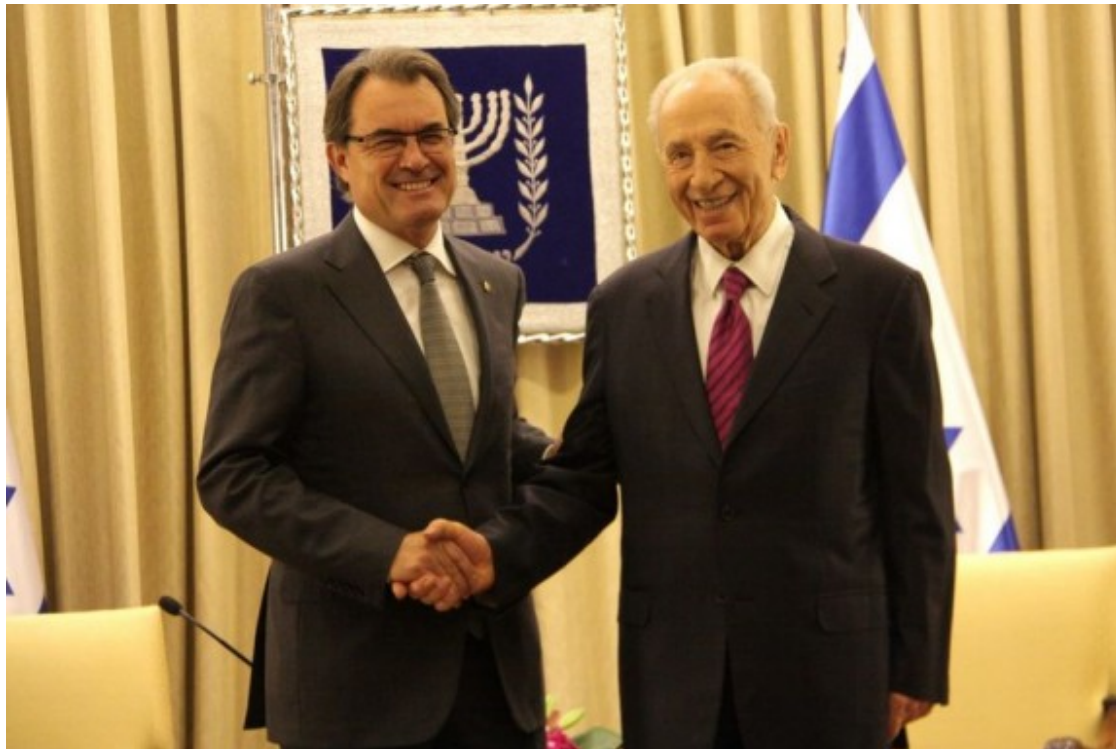
Artur Mas i Shimon Peres, en una reunió el 2013

la reunió, com es feia sempre que es rebia un polític de l'estat espanyol. Aquest fet no va passar desapercebut.