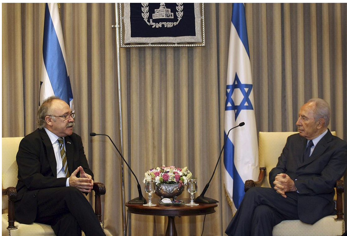
Josep-Lluís Carod-Rovira i Shimon Peres, el 2008

L'expresident d'Israel va tenir una relació molt propera amb el país i es va entrevistar amb Carod-Rovira i Mas | El funeral de Shimon Peres concentrarà les principals figures de la política internacional