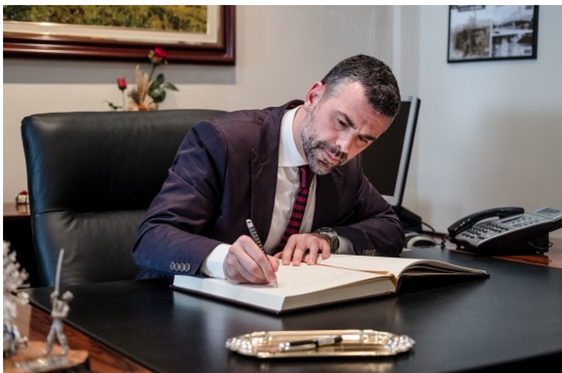
Santi Vila, en una imatge recent.