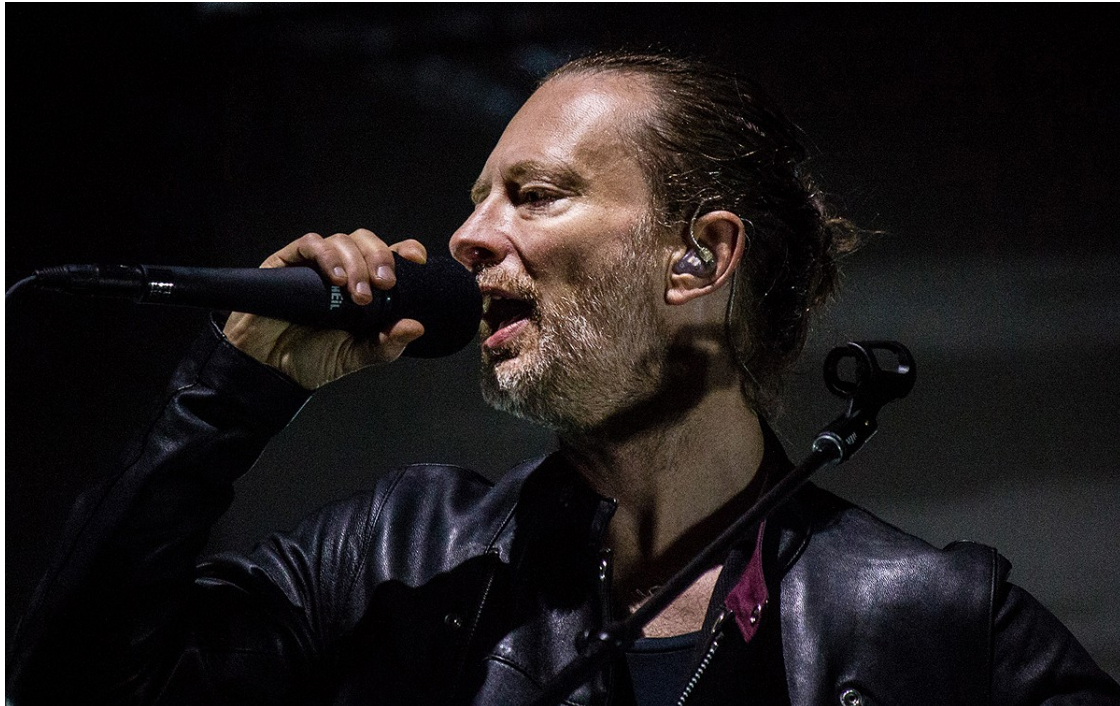
Thom Yorke, líder de Radiohead, durant el concert

El grup d'Oxford protagonitza un dels moments més memorables del Primavera Sound, amb un concert sense fissures que acaba amb "Creep"