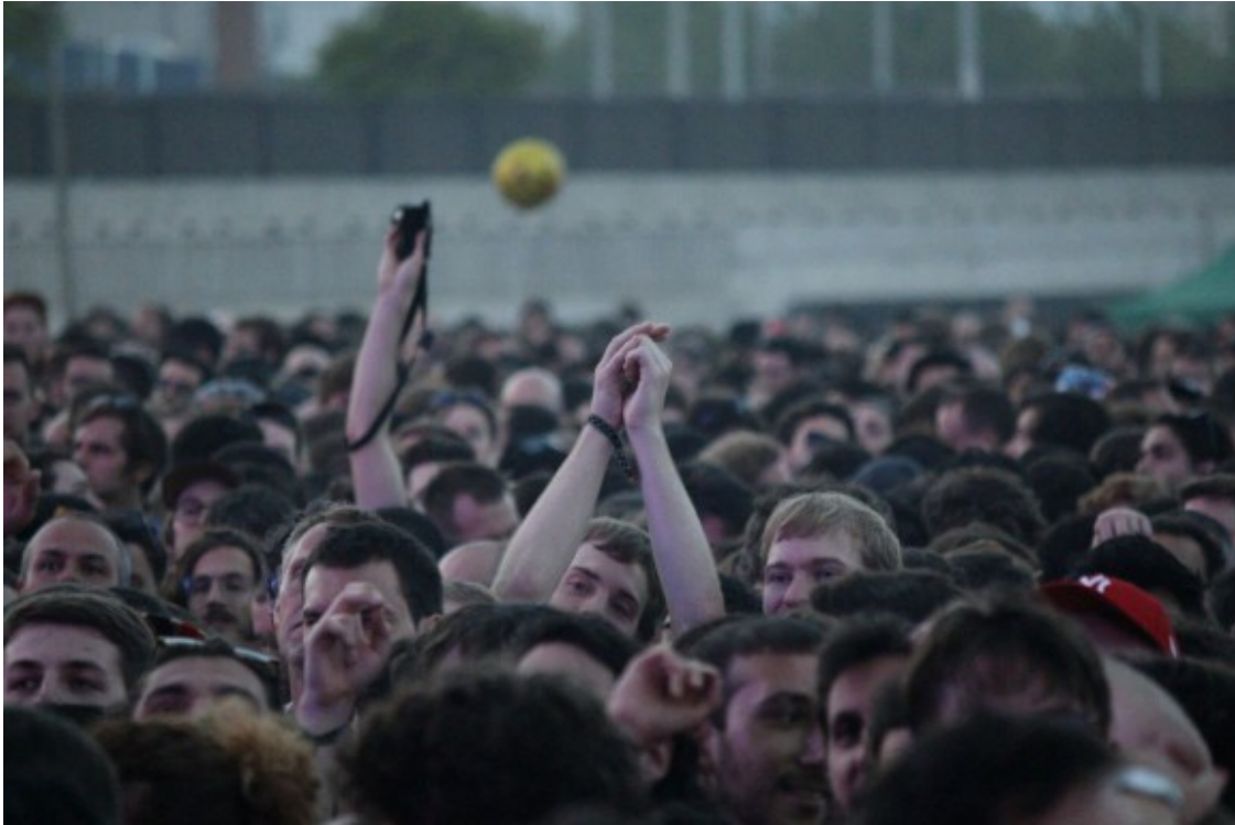
El públic, expectant per veure Radiohead