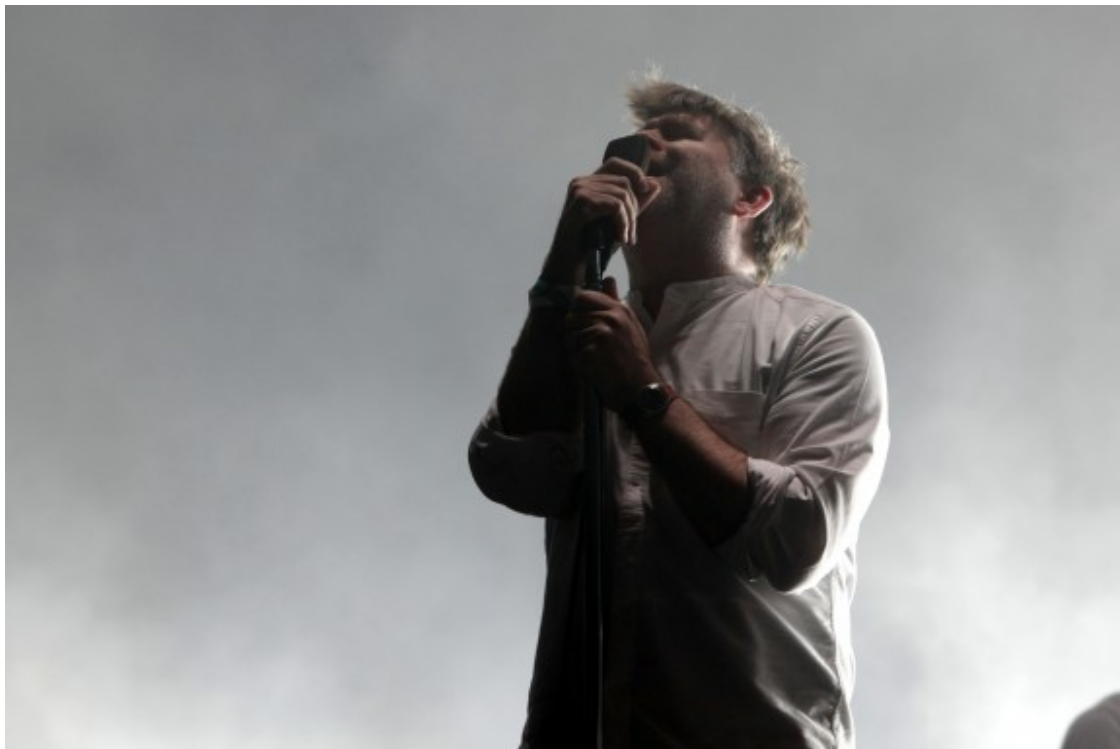
El cantant de LCD Soundsystem, James Murphy, al Primavera Sound

Entrada la nit dos dels grups que han fet continuar la multitudinària festa que és el festival, han estat LCD Soundsystem ( http://www.lcdsoundsystem.com ) , a l'escenari Heineken, i Battles ( https://en.wikipedia.org/wiki/Battles_(band) ) al Ray-Ban. Els de James Murphy han ofert el segon concert dins el Primavera Sound enmig d'una expectació massiva. Tots els hits van sonar en el retorn de la banda de Nova York al festival que els va veure quan encara eren molt joves, tretze anys enrere. Amb Battles s'ha entrat a l'última etapa de la nit amb ritmes desencaixats i guitarres metralladores. El trio de math rock electrònic ha estat a l'alçada de les circumstàncies com en la resta d'ocasions que ha visitat el festival.