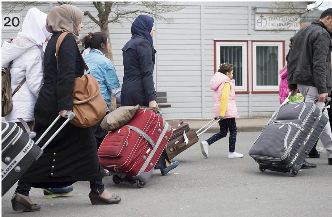
Un grup de refugiats arribant ahir a Alemanya

Oxfam Intermón demana als països desenvolupats el reassentament de 480.000 sirians | Noruega, Canadà i Alemanya s'han compromès a reallotjar a més refugiats del que els correspon | A països limítrofs com Turquia, el Líban o Jordània hi ha quasi 5 milions de sirians