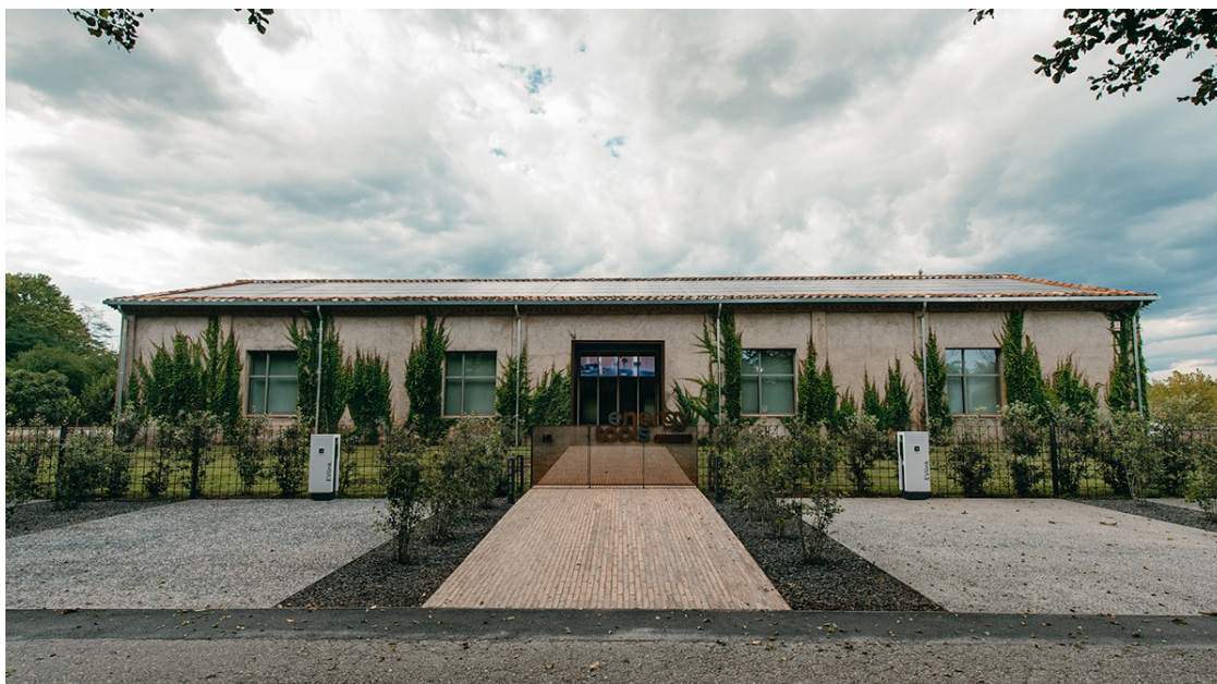
Les noves instal·lacions d'Energy Tools a la Moixina d'Olot

L'empresa olotina ha inaugurat les noves instal·lacions situades a la Moixina aquest dijous