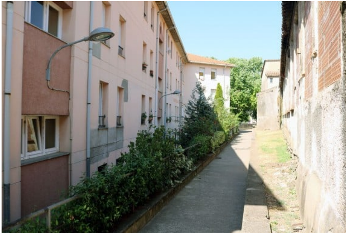
Imatge on es pot veure la proximitat de les cases amb el carreró

veïns per tal d'instaurar-les. L'objectiu és canviar l'aspecte del carreró per tal que no convidi a utilitzar-lo com un espai amagat o d'estada per a algunes persones.