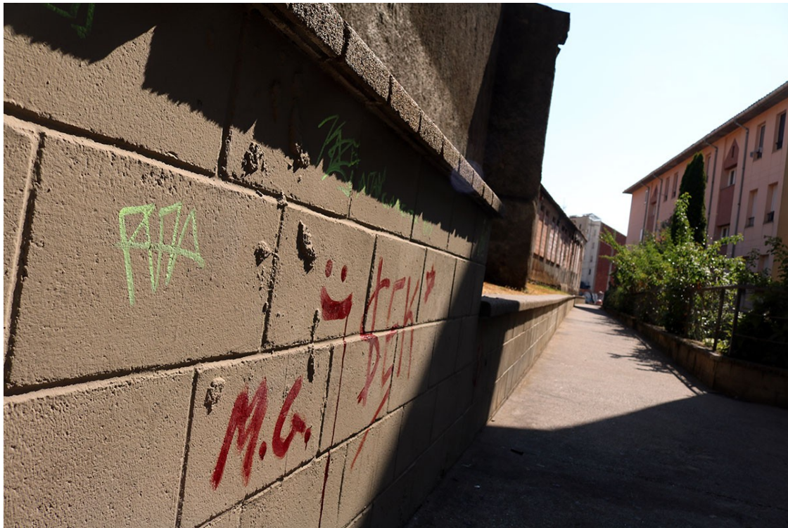
El carreró del carrer Esgleiers d'Olot amb pintades a les parets | Pau Masó

El regidor del barri ha explicat que es faran actuacions relacionades amb la vegetació o la il·luminació