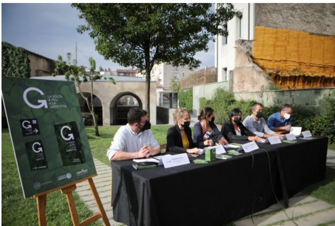
Tots els participants en la presentació als jardins del Consell Comarcal de la Garrotxa.

Proposa 10 rutes a peu, a la manera del camí de sant Jaume, amb un passaport a segellar en més de 40 establiments adherits a Turisme Garrotxa i codis QR per a les caminades