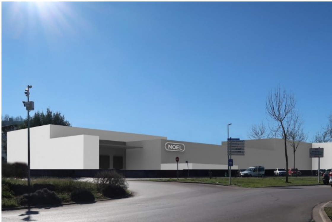
Recreació gràfica de la nova planta prevista per l'empresa Noel a Olot.

La inversió s'ha dedicat principalment a iniciar la construcció de Noel Olot , la nova planta de prop de 15.000 m2 que la companyia està construint a la capital garrotxina per potenciar la seva divisió de productes carnis frescos, que previsiblement s'inaugurarà la propera tardor; a l'expansió de la línia de productes vegetals, a l'increment de la capacitat de la planta de llescat; a la robotització dels magatzems d'expedicions o a l'actualització del sistema informàtic, entre d'altres. A banda, en un any marcat per la incidència de la pandèmia, la companyia ha destinat més de 2 milions d'euros en mesures de seguretat i prevenció per garantir en tot moment la seguretat i la salut de la seva plantilla.