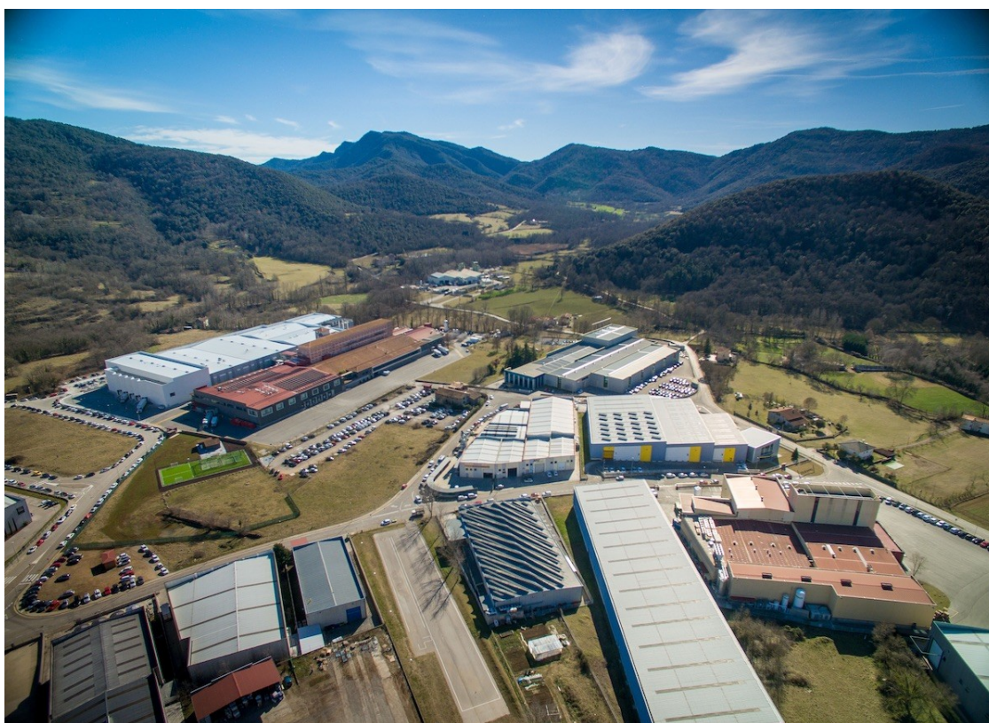
Noel a l polígon del Pla de Begudà, a la Garrotxa.

El creixement de l'empresa garrotxina és d'un 21% respecte al 2019, l'augment més important dels darrers deu anys