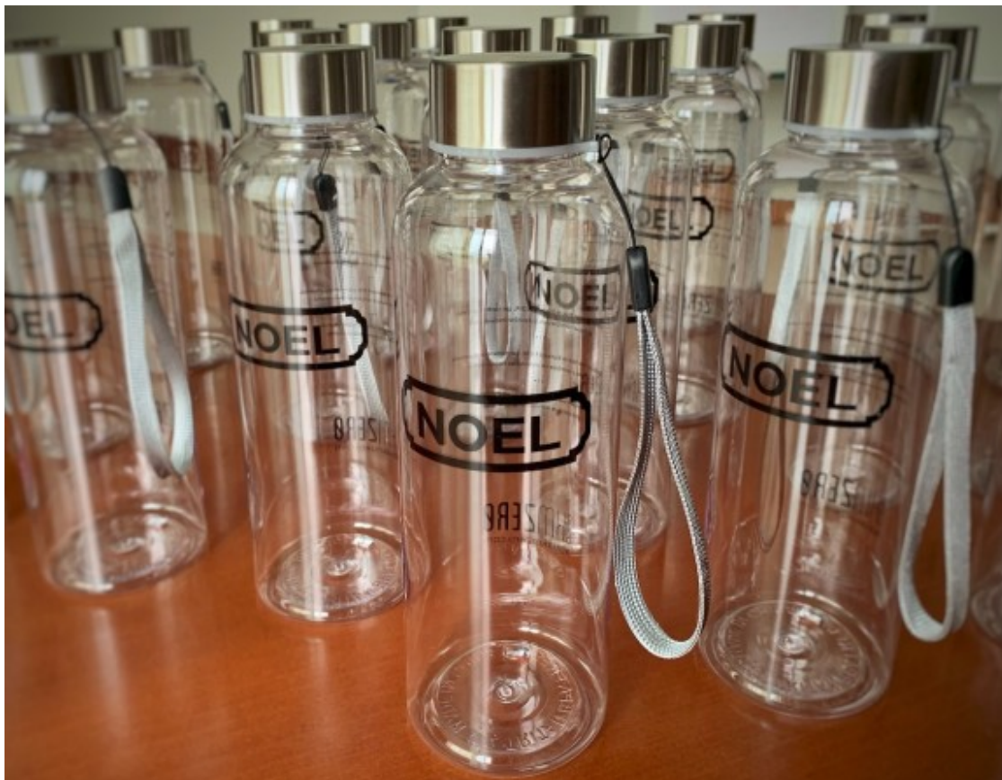
Les ampolles de la campanya «La sostenibilitat que es beu» de Noel.

Noel continua amb el desenvolupament de la seva estratègia de responsabilitat corporativa amb l'objectiu d'actuar de manera ètica i sostenible sobre tres pilars fonamentals: el medi ambient , les persones i l' acció social .