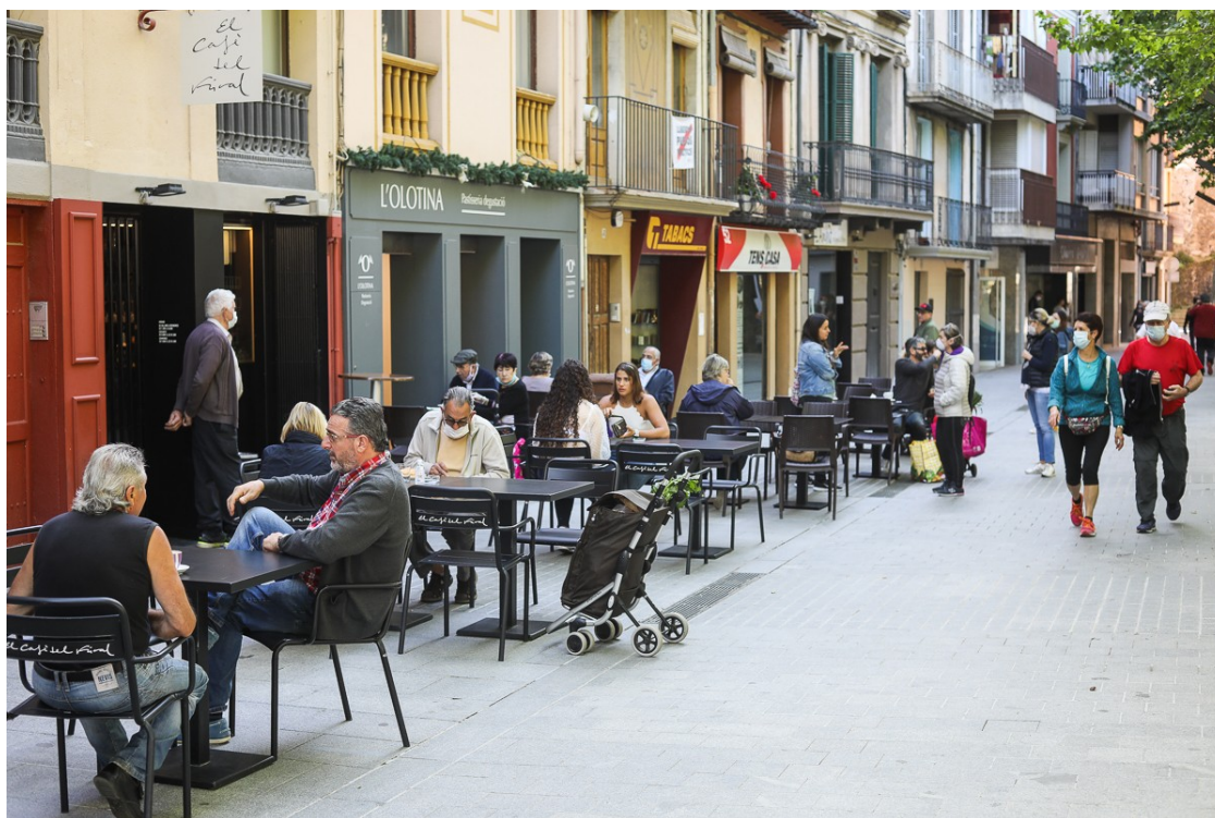
Les terrasses als cafès del Firal d'Olot.

Mentre la velocitat estadística de reproducció de contagis se situa en 0,87 i el risc de rebrot vora els 100 punts, només romanen 4 grups escolars confinats a tota la comarca