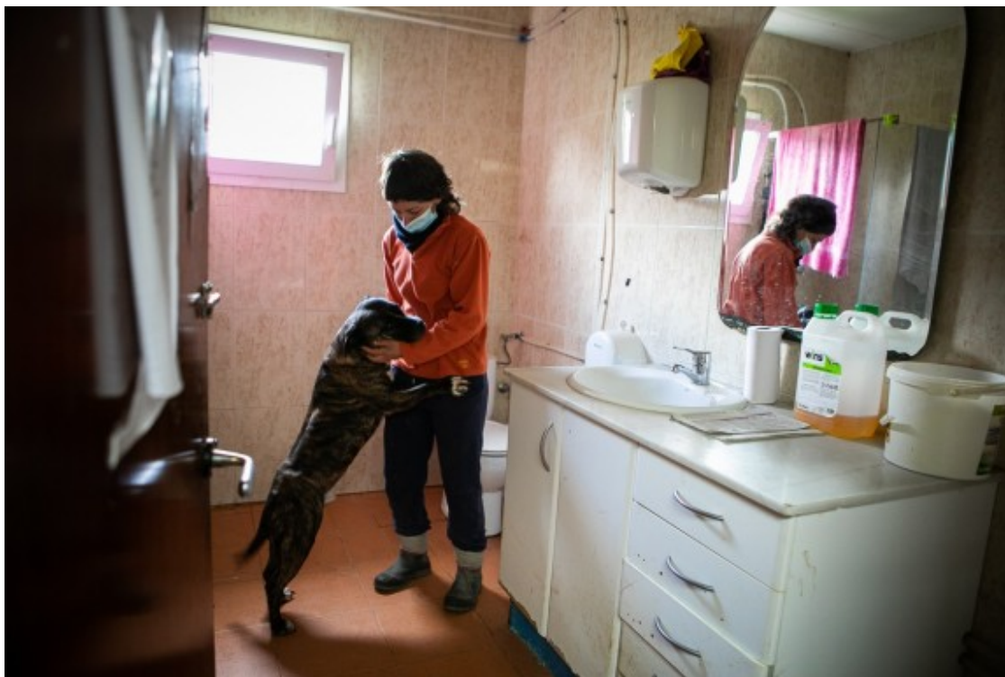
El gos Tigre viu al lavabo de Terra Viva.

A Terra Viva pensen que el centre de recollida d'animals "no compleix amb els requisits de capacitat i adequació necessaris" per a donar un servei correcte ni garantir la seguretat, no només dels animals sinó també dels treballadors que s'hi escarrassen amb cura i estima per les bèsties.