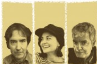
Crear amb les paraules. De quina manera? Dijous 25 març - 20:00