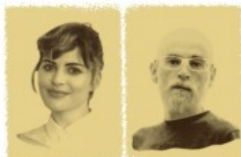
I sempre és una altra cosa Dijous 25 març - 18:00