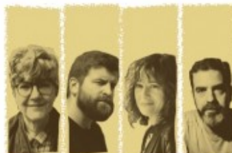
Ver-MOT - Més enllà de les paraules Dissabte 27 març - 12:00

Alguns dels autors i de les converses que es podran seguir al MOT 2021 a Olot.