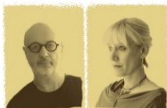
Una xarxa de connexions múltiples Divendres 26 març - 20:00