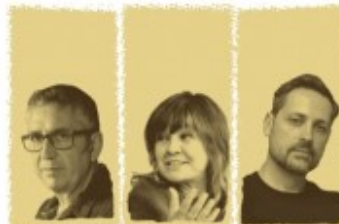
Ignor Divendres 26 març - 18:00