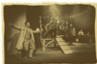
Novecento Divendres 26 març - 20:30