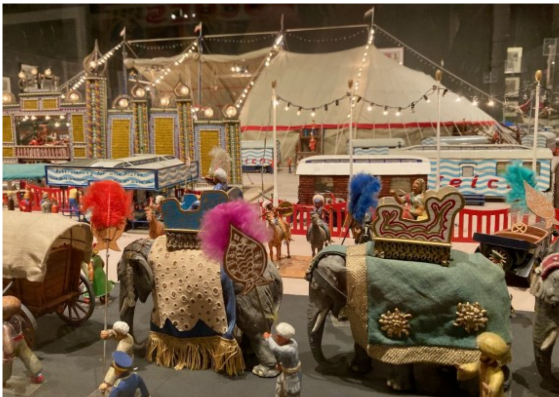
Part de l'enorme maqueta a escala del Circ Gleich.