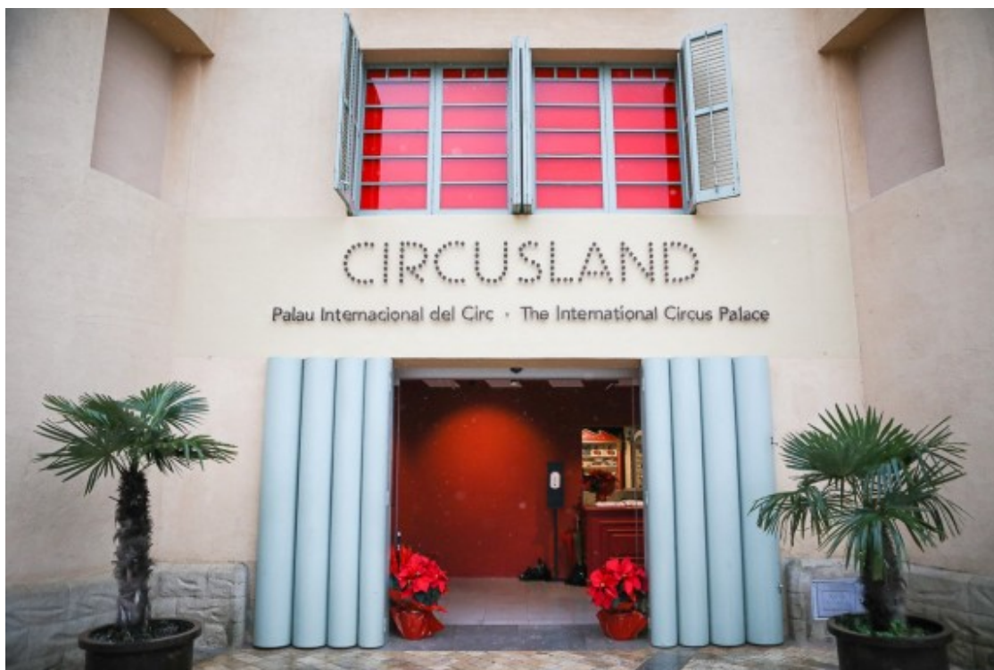
L'entrada a Circusland, a Besalú.

En paraules del creador Gran Circ de Nadal al Pavelló Municipal de Girona-Fontajau i del Festival Internacional del Circ, Circusland és "l'única institució patrimonial a Europa dedicada en exclusiva a la història de l'activitat i present circense". La missió del Palau del Circ serà la recopilació, conservació, investigació, difusió i exhibició del llegat cultural que sobre el circ s'ha produït en el món des dels seus orígens.