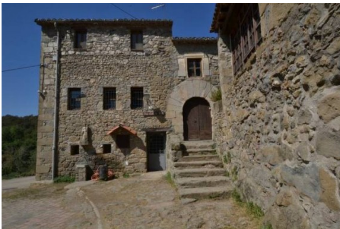
El Mas Coll de Dalt, a Sant Iscle de Colltort, a Sant Feliu de Pallerols, acull 35 joves en tutela.

Segons el batlle de la Vall d'en Bas, l'experiència professional i la formació inclosa al programa permetrà als joves obtenir un certificat de professionalitat que els ajudarà a accedir al mercat laboral un cop finalitzin el programa. A la Garrotxa, els joves estan participant en accions per assolir, en concret, el Certificat de professionalitat de neteja en espais oberts i instal·lacions industrials o el Certificat de professionalitat activitats auxiliars en vivers, jardins i centres de jardineria.