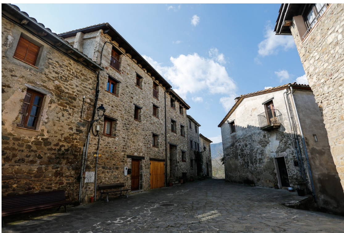
Carrers de Mieres, un dels pobles de la Garrotxa.

Entre les inversions municipals s'ha previst la instal·lació de plaques solars a l'escola o la substitució de les canonades de fibrociment