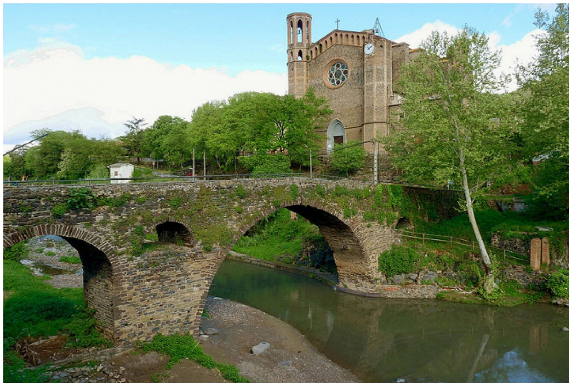
El pont medieval de Sant Joan les Fonts. | @santjoanfontsj.

L'objectiu és posar en valor aquesta infraestructura clau i imaginar com era al segle XIII, amb una visita el dissabte 10 d'octubre a migdia