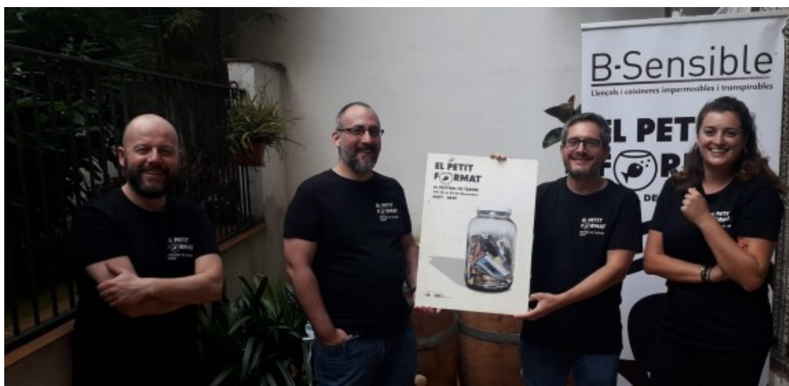
Els membres d'Una Càpsula de Teatre amb el cartell d'enguany d'El Petit Format.