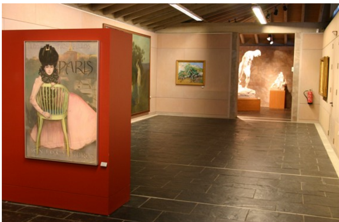
Interior del Museu de la Garrotxa.

L'exposició es pot visitar del 5 de setembre al 10 de gener a la Sala Oberta