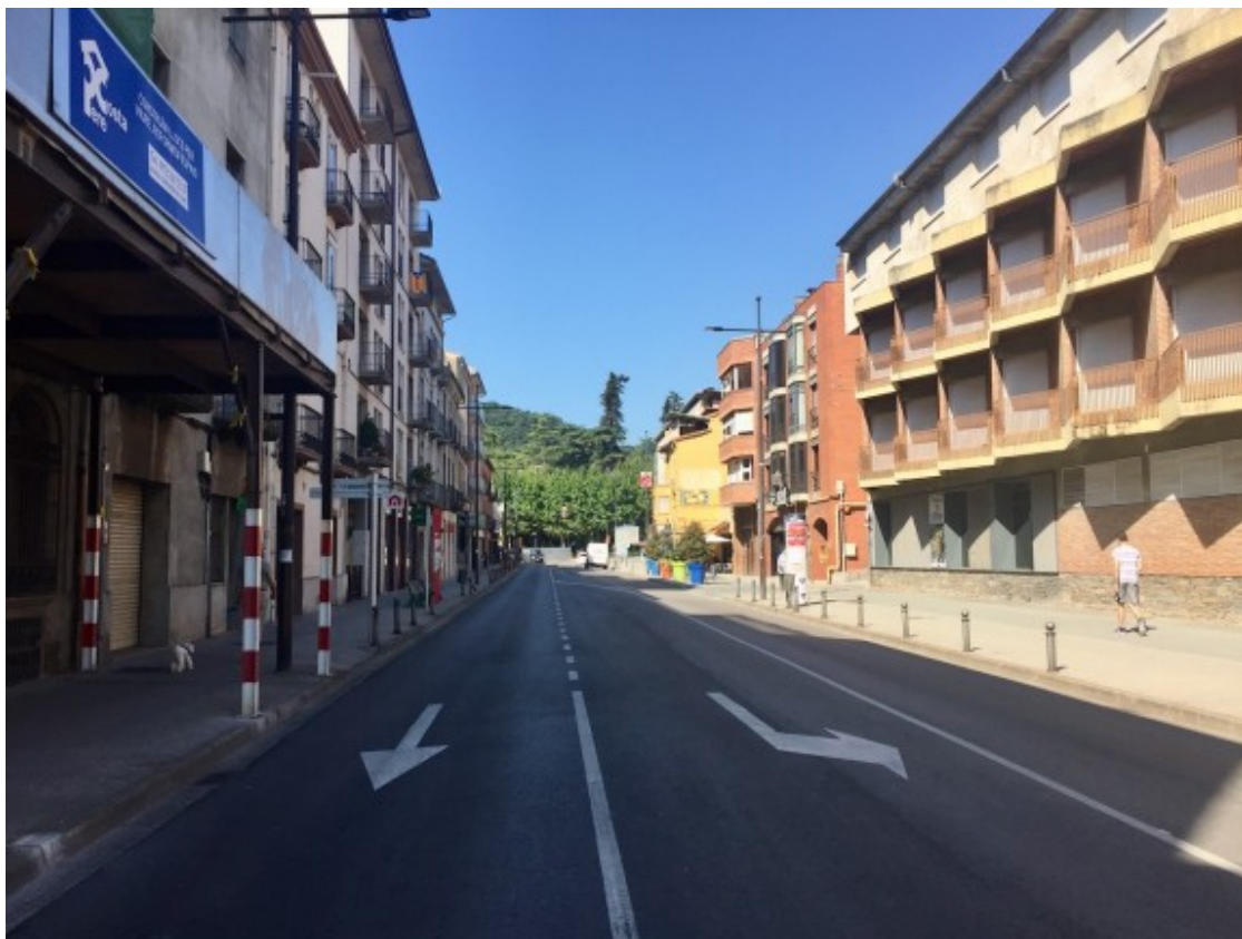
Imatge inèdita del primer tram del carrer Mulleras buit.

Habitualment, per tal d'evitar problemes de mobilitat i embussos, dos agents de la Policia Municipal s'encarreguen d'adreçar i dirigir el trànsit en aquesta cruïlla. En les pròximes setmanes, amb el mercat setmanal dels dilluns, i l'obertura de les escoles, es veurà si augmenten les dificultats o tot flueix com fins ara.