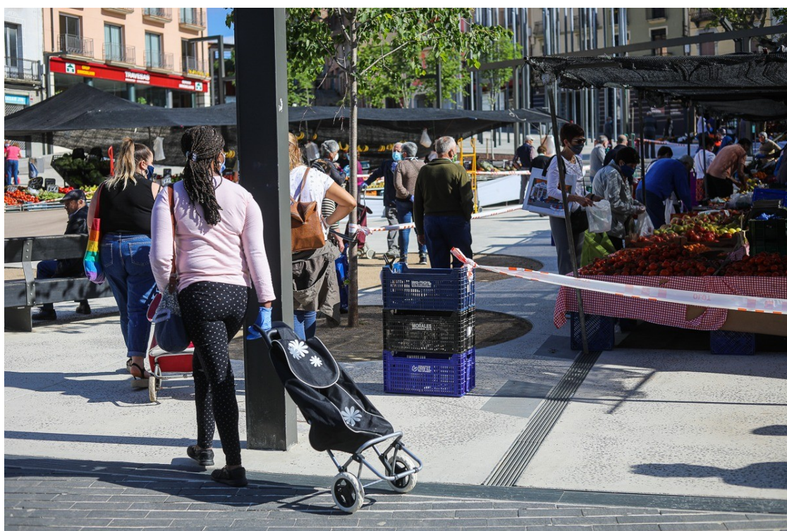
El mercat setmanal dels dilluns a Olot durant l'estat d'alarma.

Aquest dilluns, 25 de maig, 40 paradistes que ho han demanat ja seran al Firalet d'Olot en els horaris habituals de venda