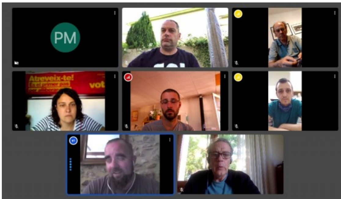
Instantània de la conferència de premsa virtual de la CUP Olot.

Per bé que aquesta moció s'havia de presentar molt més enllà en el temps, el desconfinament n'ha provocat l'acceleració. Fa temps, doncs, que treballaven en "la línia d'una ciutat moderna i ecològica, on no tinguin cabuda les emissions de CO2, sense saber que arribaria una situació d'emergència que ens obligaria a accelerar els plans i adaptar-los a la nova realitat".