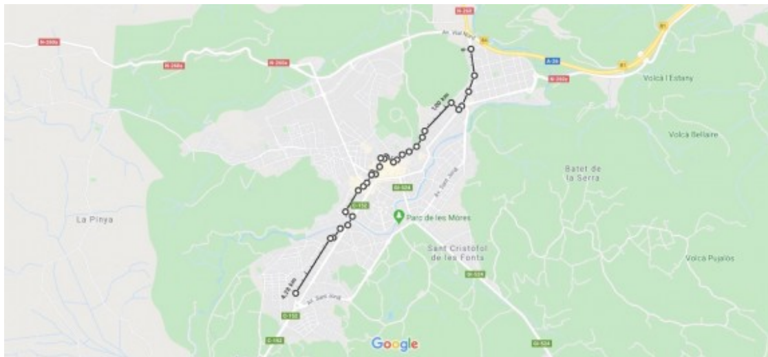
Un dels carrils bici proposats per ERC Olot.

A la vegada, un estudi del RACE diu que un 25% de la gent que abans es desplaçava a peu per anar a la feina, farà servir el cotxe quan s'acabi el confinament. Aquest increment de trànsit agreujarà de forma alarmant la situació d'emergència climàtica que continua vigent malgrat el confinament.