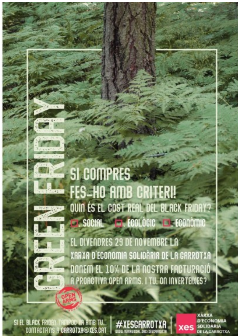
El cartell del Green Friday de la XES Garrotxa.