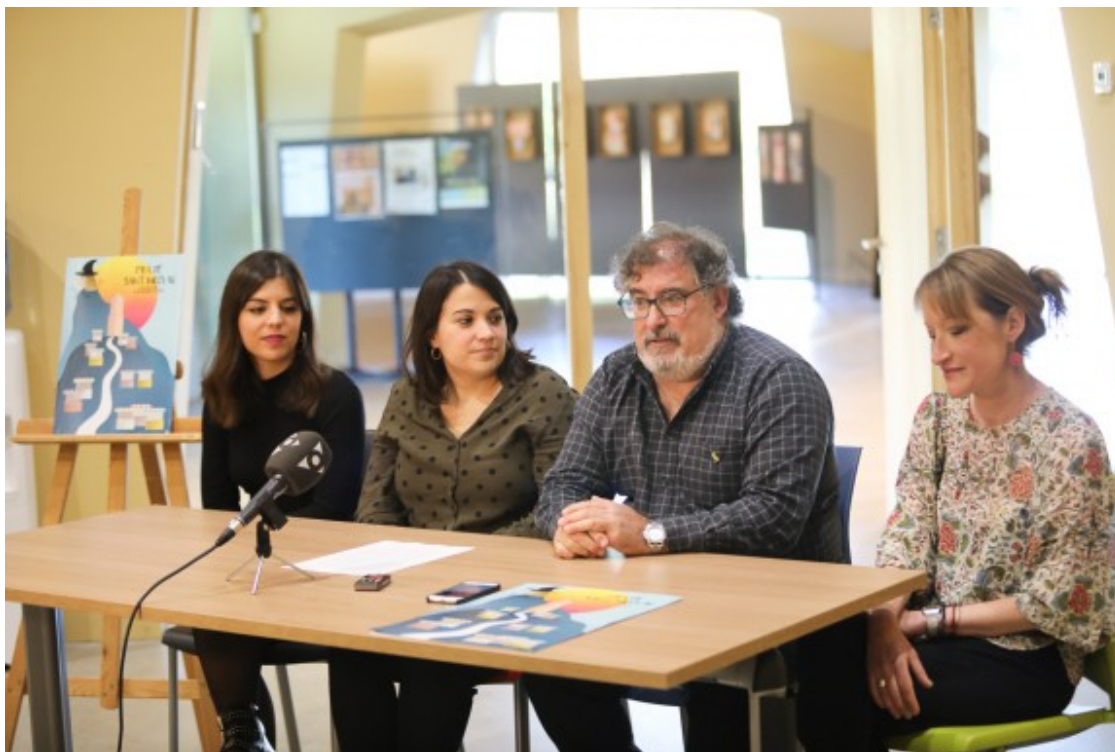
Els actes de retorn de SomVallBas es van presentar a Can Trona.

defineixen quines són les principals preocupacions dels habitants de la Vall, quins són els punts de patrimoni que els basencs volen salvaguardar i quins estan en perill d'extinció i què s'hi pot fer.