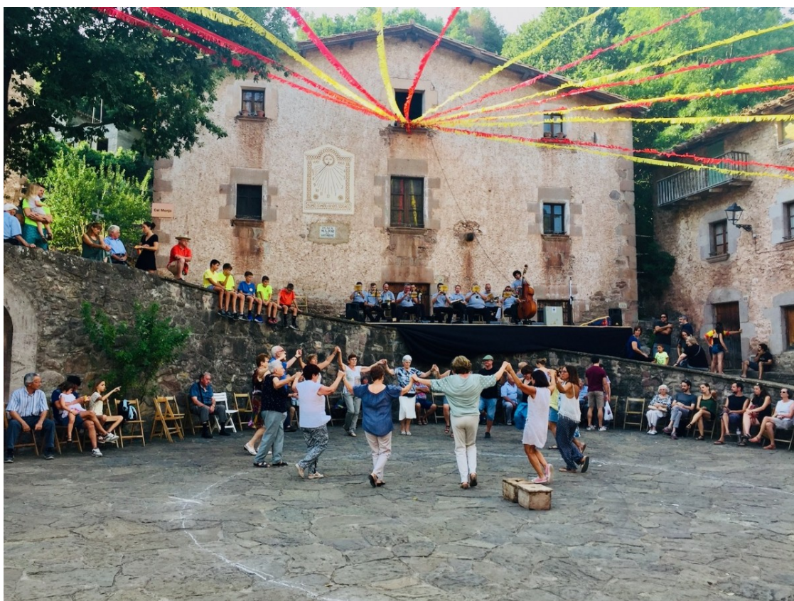
La plaça de Sant Privat d'en Bas durant la Festa Major d'aquest estiu. | Xavier Borràs.

L'activitat consistirà en quatre col·loquis amb quatre temàtiques ben diverses, repartides en diferents punts de la Vall: Sant Esteve d'en Bas, Sant Privat d'en Bas, Joanetes i els Hostalets