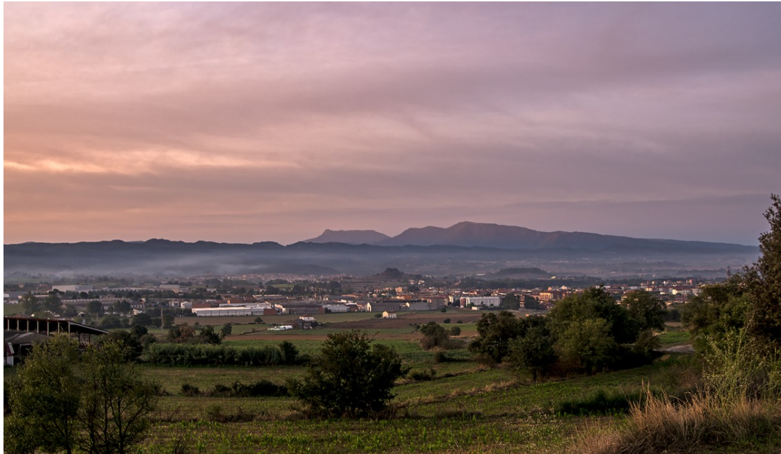
Albada rosada aquesta setmana a Manlleu | Carme Molist

Els ruixats afectaran diversos punts del país a partir d'aquesta tarda i en els pròxims dies baixarà la temperatura