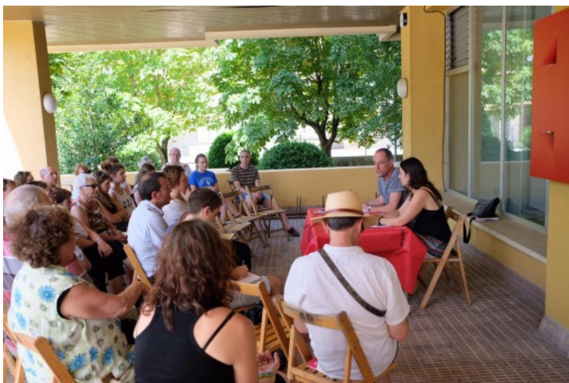
Un moment de la presentació als locals de Creu Roja Garrotxa al carrer d'Hondures d'Olot.

Amb 2.788 socis i 110 voluntaris ha atès 1.130 persones en situació de vulnerabilitat