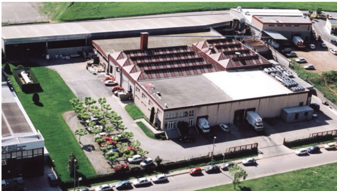
La planta de Noel a Sant Joan les Fonts.