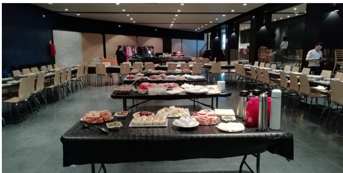
Aspecte de l'Iftar popula de 2018 al Torín d'Olot.

És el trencament del dejuni per els musulmans que se celebrarà a la Sala El Torín d'Olot a les 20:00 h