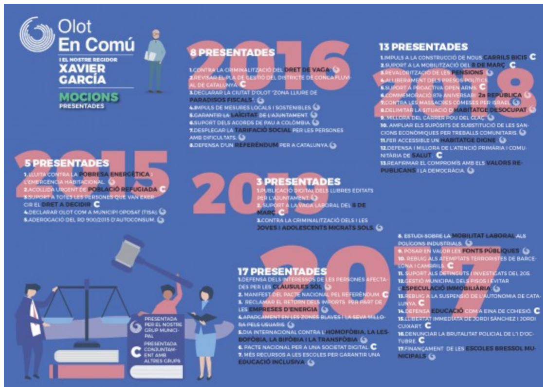
Quadre descriptiu de les mocions presentades per Olot en Comú durant aquest mandat.

aprovades, amb la voluntat "de ser útils als ciutadans i ajudar a solucionar els seus problemes".