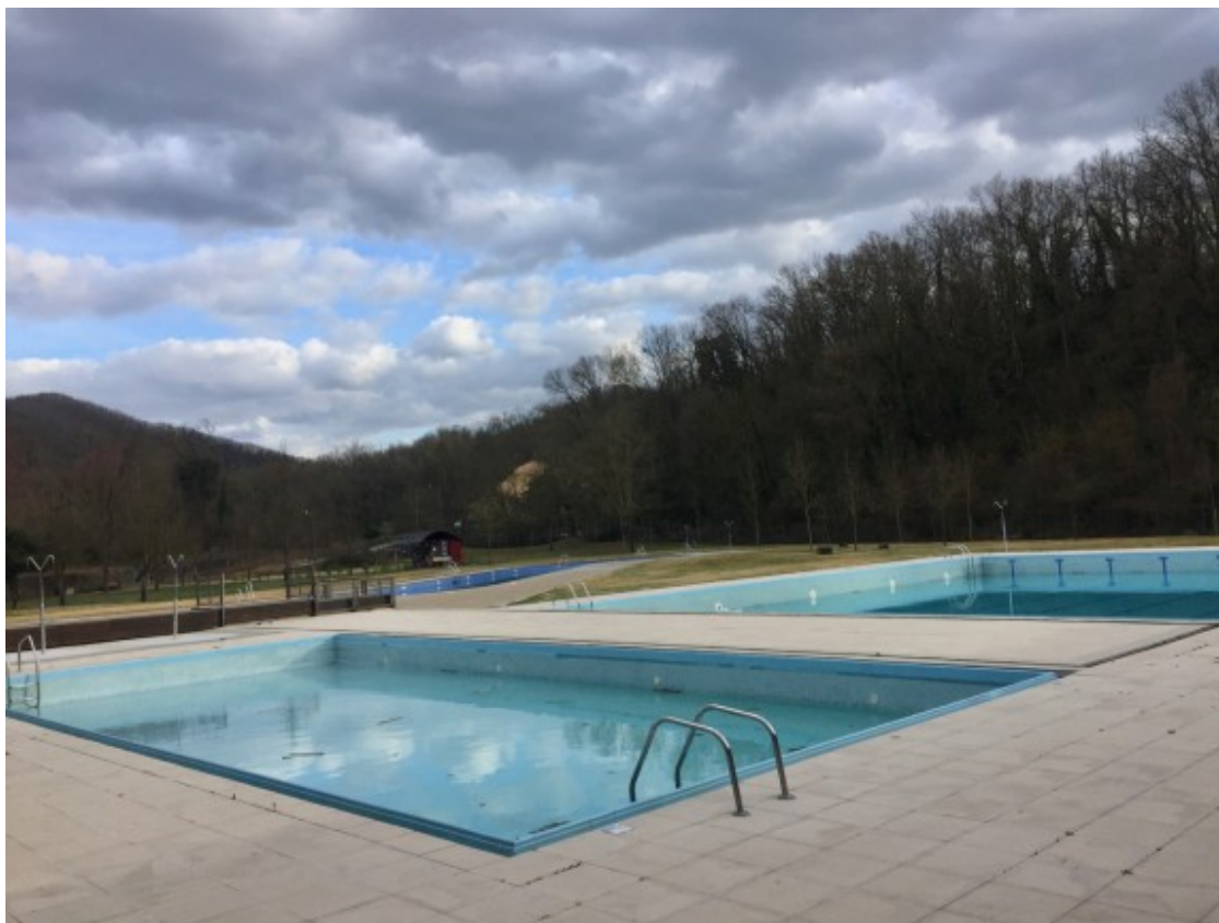
La piscina en primer terme desapareixeria per a situar-hi tota la nova maquinària.

En el Pla de Govern Olot 2015-2019 ja s'inclouïa com a prioritat l'elaboració d'un projecte integral per a determinar la viabilitat i el model d'instal·lació d'una piscina municipal coberta. Durant aquest mandat, doncs, s'ha està treballant en la proposta tècnica per a la construcció i posada en marxa d'una piscina municipal climatitzada a la ciutat.