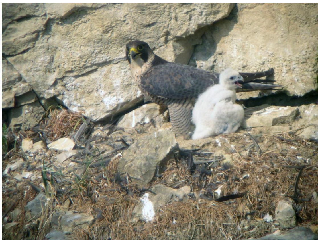
Un falcó pelegrí amb la seva cria. | Georges Lignier/Wikipèdia.

Se sortirà des de la Canya aquest dissabte 25 d'agost, a dos quarts del nou del matí