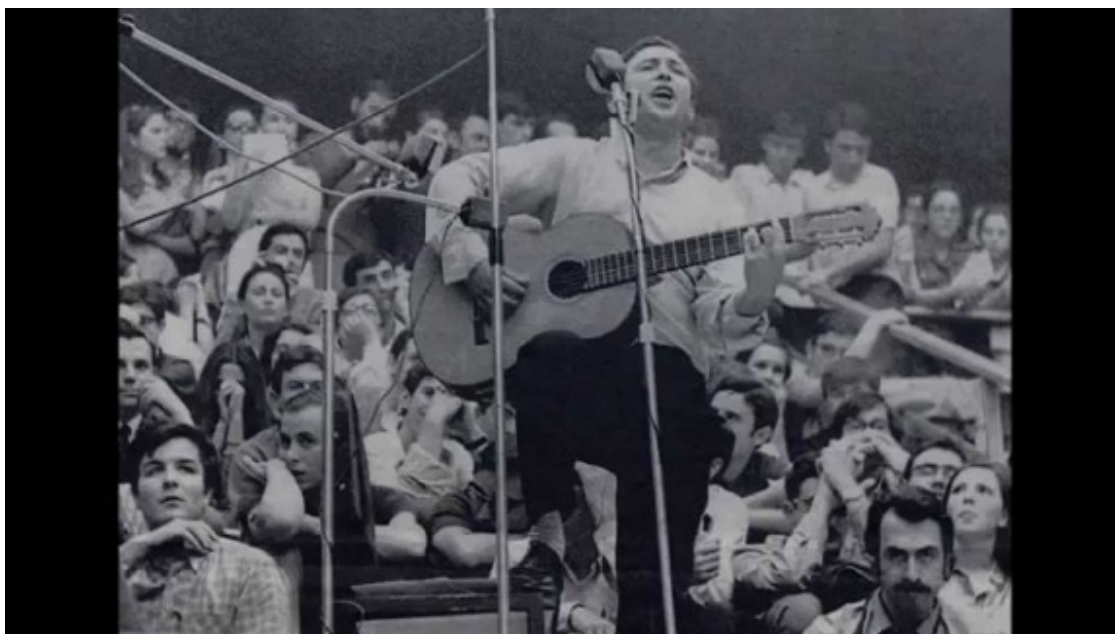
El concert de Raimon a la Facultat d'Econòmiques de la Complutense va tenir lloc en ple maig francès.