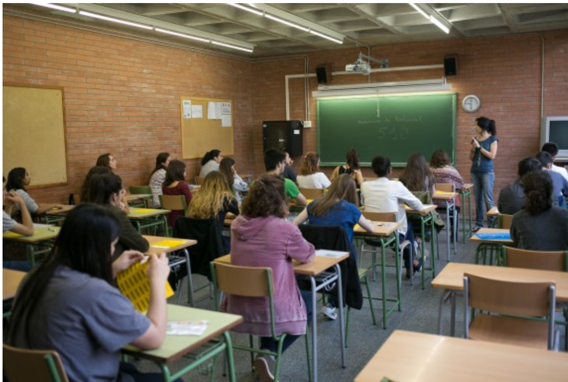
L'Institut Montsacopa és la seu dels exàmens de selectivitat pels estudiants de la Garrotxa.

Els alumnes que obtinguin un 5 de mitjana entre la nota de batxillerat (que té un valor del 60%) i la qualificació obtinguda en la fase general de les PAU (amb un valor del 40%, si la qualificació d'aquesta fase general és com a mínim de 4), hauran superat les PAU i, per tant, tindran nota d'accés a la universitat. Amb les dues millors qualificacions de la fase específica, es calcula la nota d'admissió que pot arribar fins als 14 punts.