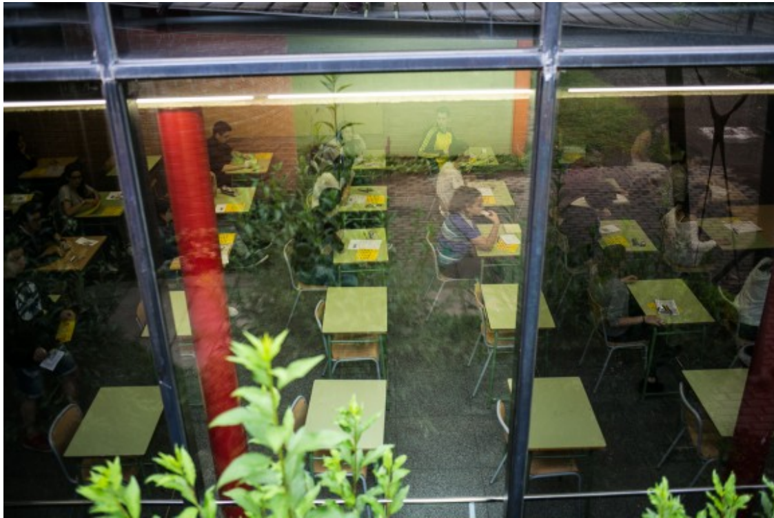
Llengua i literatura castellana ha estat el primer dels exàmens de selectivitat.