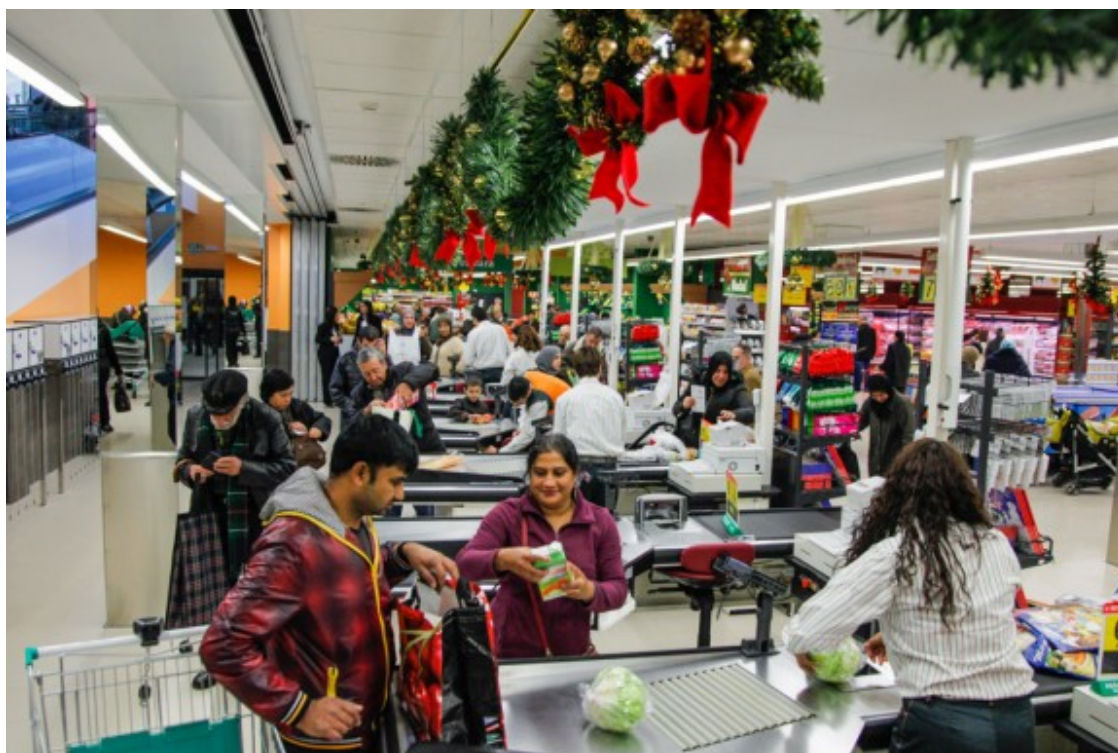
Molts olotins ja han baixat al supermercat instal·lat al soterrani de la nova Plaça Mercat.