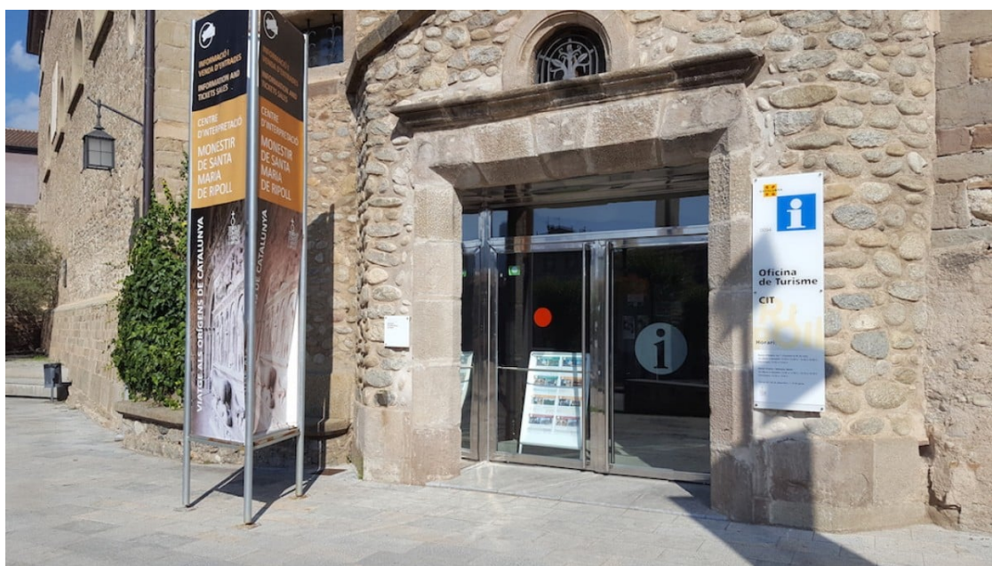
L'Oficina de Turisme de Ripoll.

La majoria han estat el mes d'agost i de la mà, principalment, de turistes de Barcelona