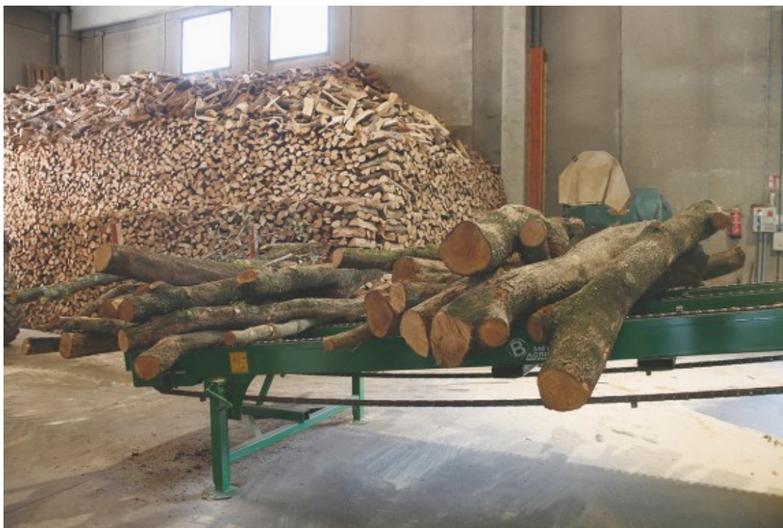
Troncs i llenya emmagatzemada a Sant Pau de Segúries

"En el fons el que volem és dinamitzar la gestió forestal perquè la necessitem per adaptar-nos al canvi climàtic, per fer prevenció d'incendis, però també per extreure el propi recurs del bosc", ha dit Sanitjas.