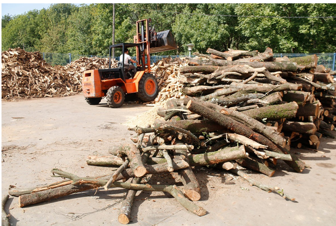
Punt de venda de llenya al Ripollès

Des del Ripollès, les empreses constaten l'allau de comandes que estan rebent les empreses productores