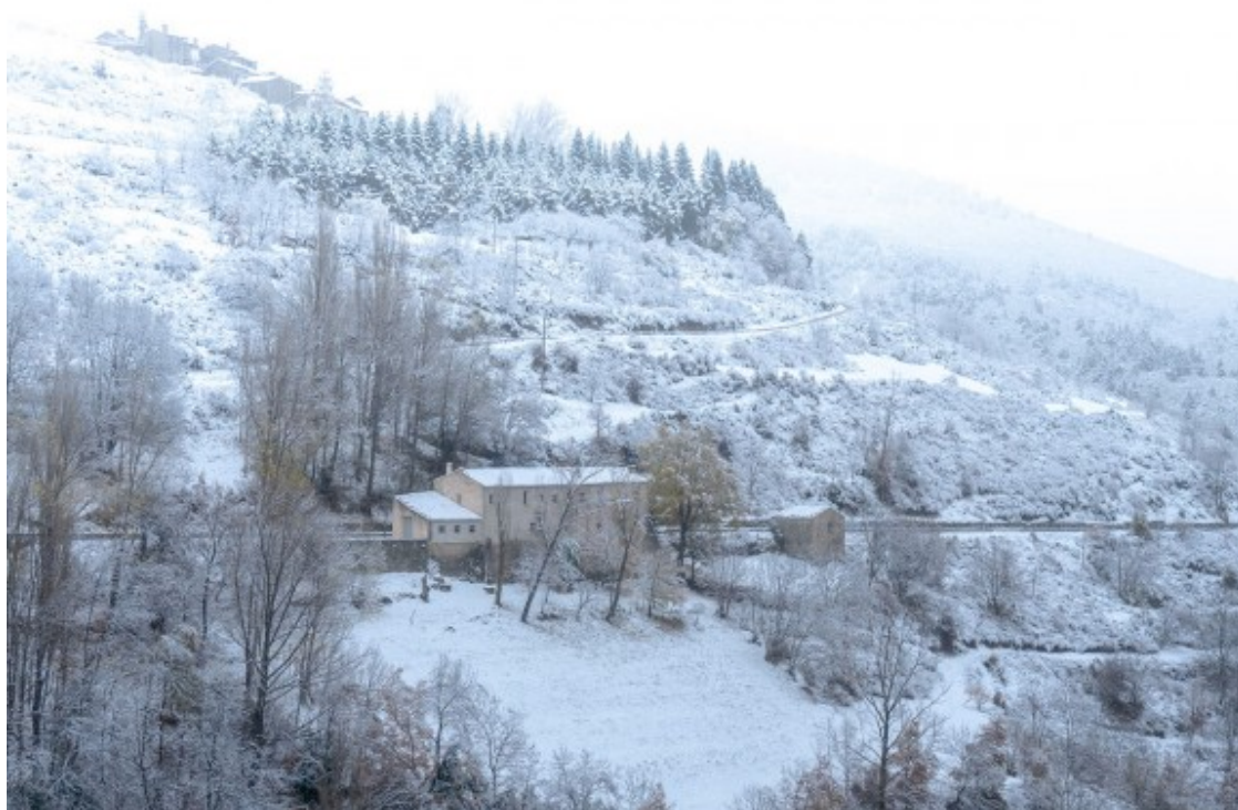
La neu ha arribat a cotes mitjanes.