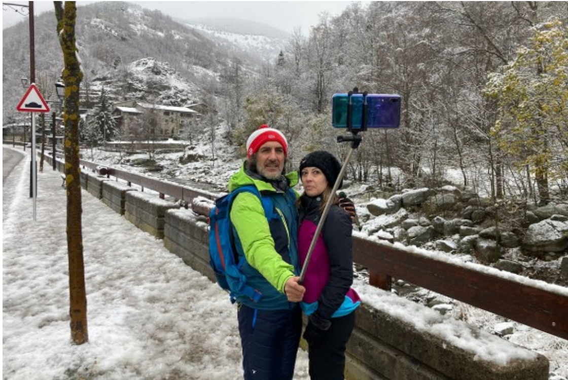
Una parella, fent-se una foto a Setcases.