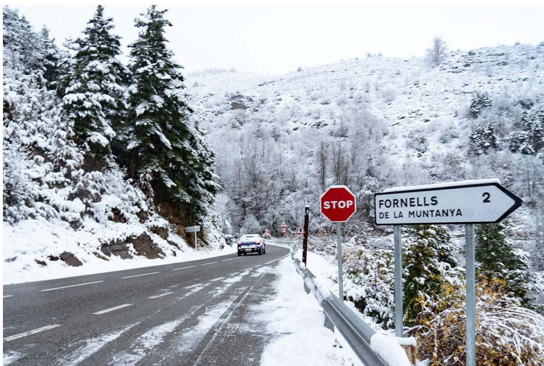
La collada de Toses, aquest matí

La llevantada deixa entre 30 i 40 litres d'aigua a la comarca i una enfarinada a llocs com Setcases o Planoles