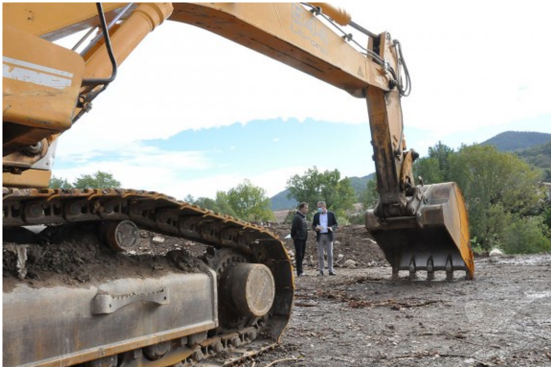
Ramon Roqué i Joaquim Colomer han visitat les obres.

L'espai guanyat amb el moviment de terres permetrà també disposar d'una zona enjardinada. A part d'embellir el talús, separarà visualment l'aparcament respecte al passeig de l'estació i els seus habitatges.