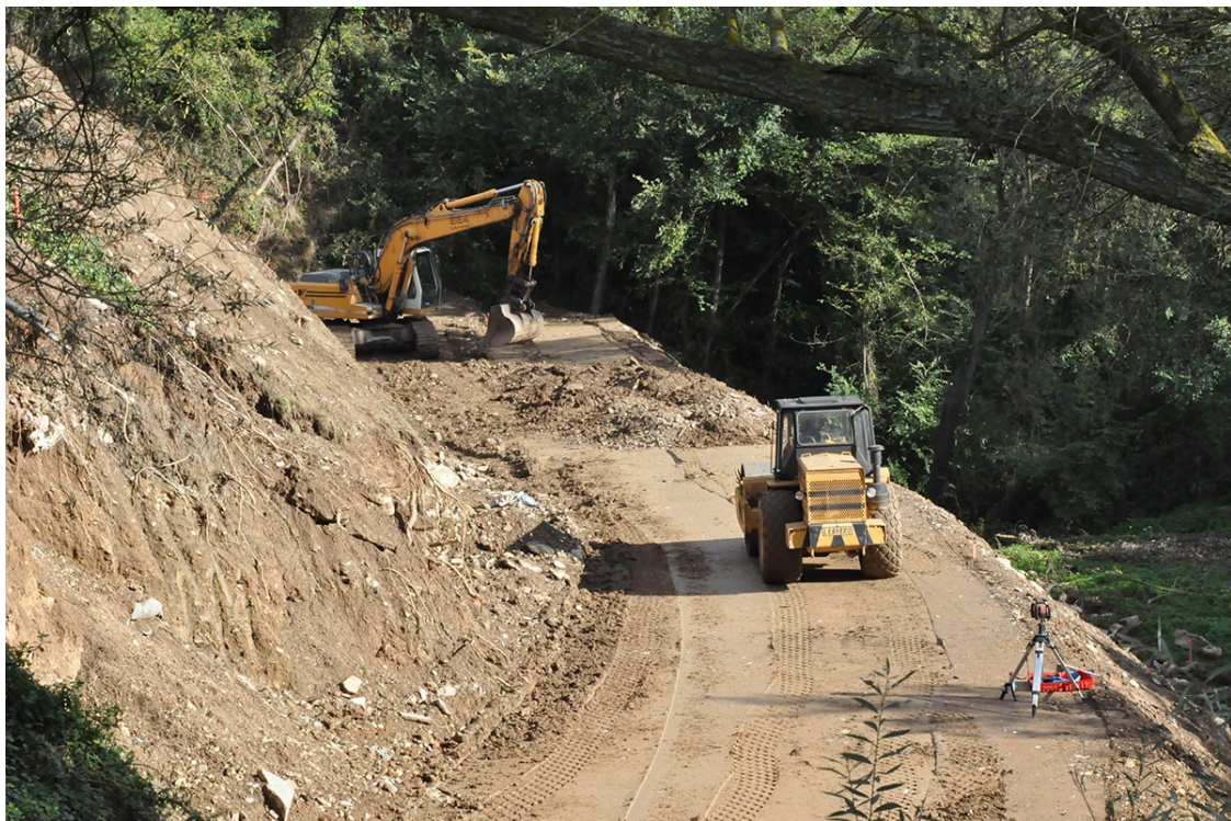
Les excavadores, treballant a la zona

Els treballs inclouen l'ampliació de l'aparcament, una nova zona enjardinada i la recuperació del bosc de ribera