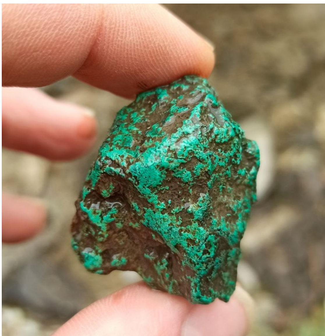
Fragment de malaquita recuperat a la cova.

És una de les conclusions de la darrera campanya arqueològica que s'ha fet aquest estiu. Concretament, des del 26 d'agost i fins al 6 de setembre amb investigadors de l'IPHES-CERCA i de l'Àrea de Prehistòria de la Universitat Rovira i Virgili (URV). El primer cop que es va explorar va ser l'any 2012 per part del Grup d'Investigació en Arqueologia del Paisatge (GIAP), de l'Institut Català d'Arqueologia Clàssica (ICAC-CERCA). El 2018 es va fer una segona intervenció i aquesta última, ha estat la tercera.