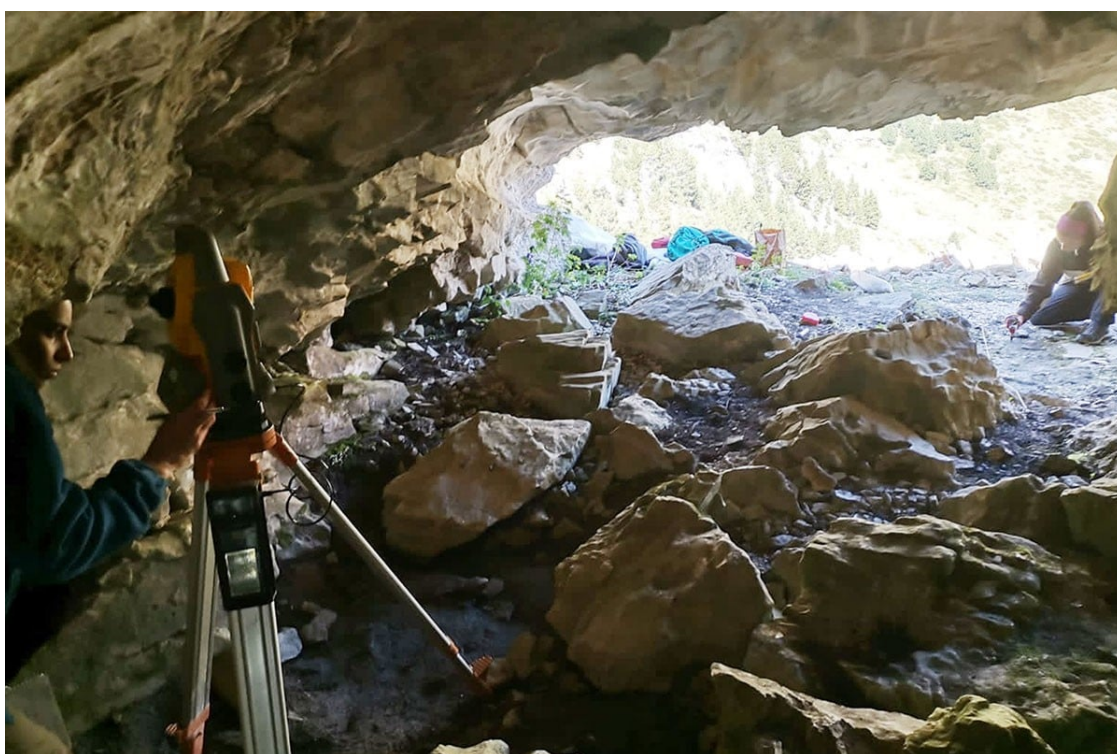
Imatge interior de la cova

La campanya arqueològica permet recuperar fragments d'indústria lítica, ceràmiques i restes d'os bru de fa 5.500 anys