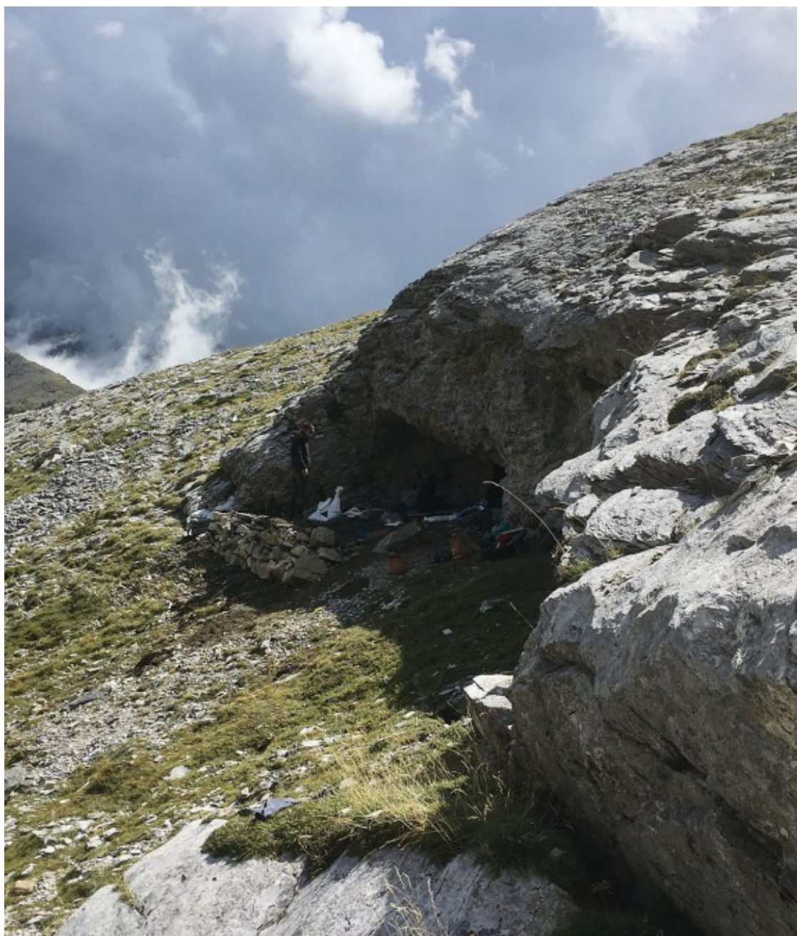
Vista exterior de la cova de Núria.