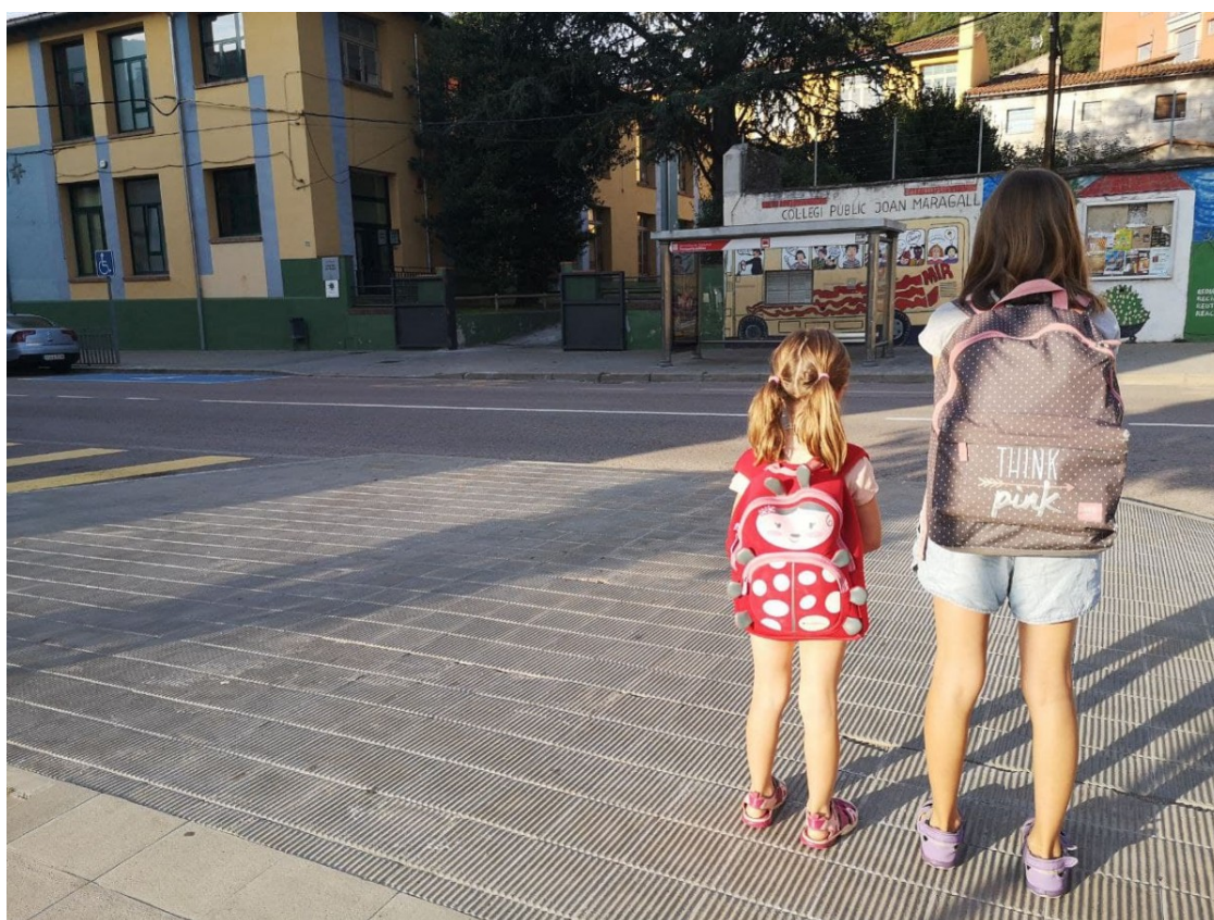
Dues nenes es dirigeixen a la seva escola de Ripoll, aquest dilluns

No cal dur mascareta a infantil i es mantenen els grups bombolla, però les mesures es revisaran en funció de l'evolució de la pandèmia i la vacunació