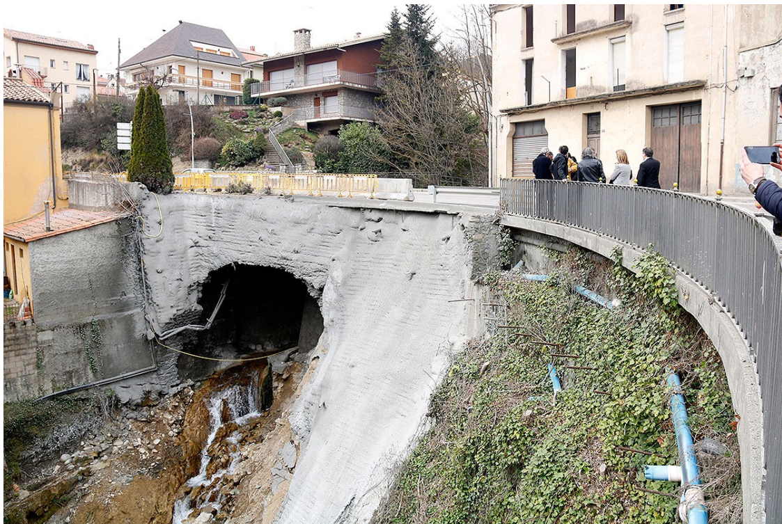
Les autoritats, a la zona de les obres

Els treballs permetran reordenar la cruïlla amb un giratori que connectarà amb la GIV-5211 en direcció a Ogassa