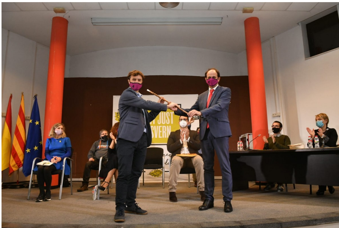
Relleu a l'alcaldia de Sant Just Desvern

L'anterior alcalde va presentar la dimissió per problemes de salut